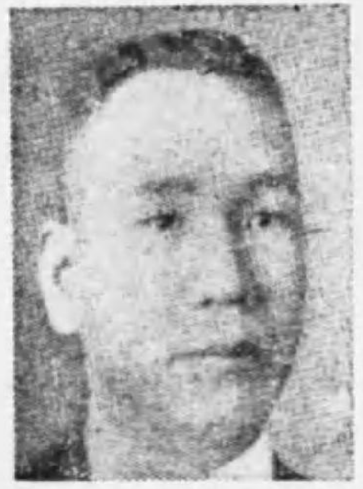
山樞氏 今度選挙 肅正運動が非常な勢 いで起つて來たとい ひで起つて來たとい ふことは、先刻他の 方々からお話になつ たやうに、これは一

肅正するといつても、看板を上げてゐる者が似たり 寄つたりの者であつては、唯金を使はさずにやつた といふことにしかならない。だから、一方では今度 金が要らないと云ふことになるが、何といふか、維 新の初め頃と云ふか、二十三年の憲法發布當時の如 くといふか、もう少し熱のある、もつと意氣のある 候補者が澤山出ると云ふやうな事になつて、そこ で選挙肅正と相俟つて相當な顔觸れが出ると云ふと その出た者が意義のあることになるし、危機にある 日本國家の將來にも吾々は大いに意を安めるやうな ことになると思ふ。選挙の肅正も肅正であるが、ど うすればもつとよい候補者を選び出し得るかといふ ことに就ても、どうか皆様のお考へを煩はしたい。 まあ、その他その肅正が餘り厳し過ぎて、又民政 政友が餘り調子を合せて、定員だけの候補者を立て ゝ無投票で済むといふことになれば、これは又餘り