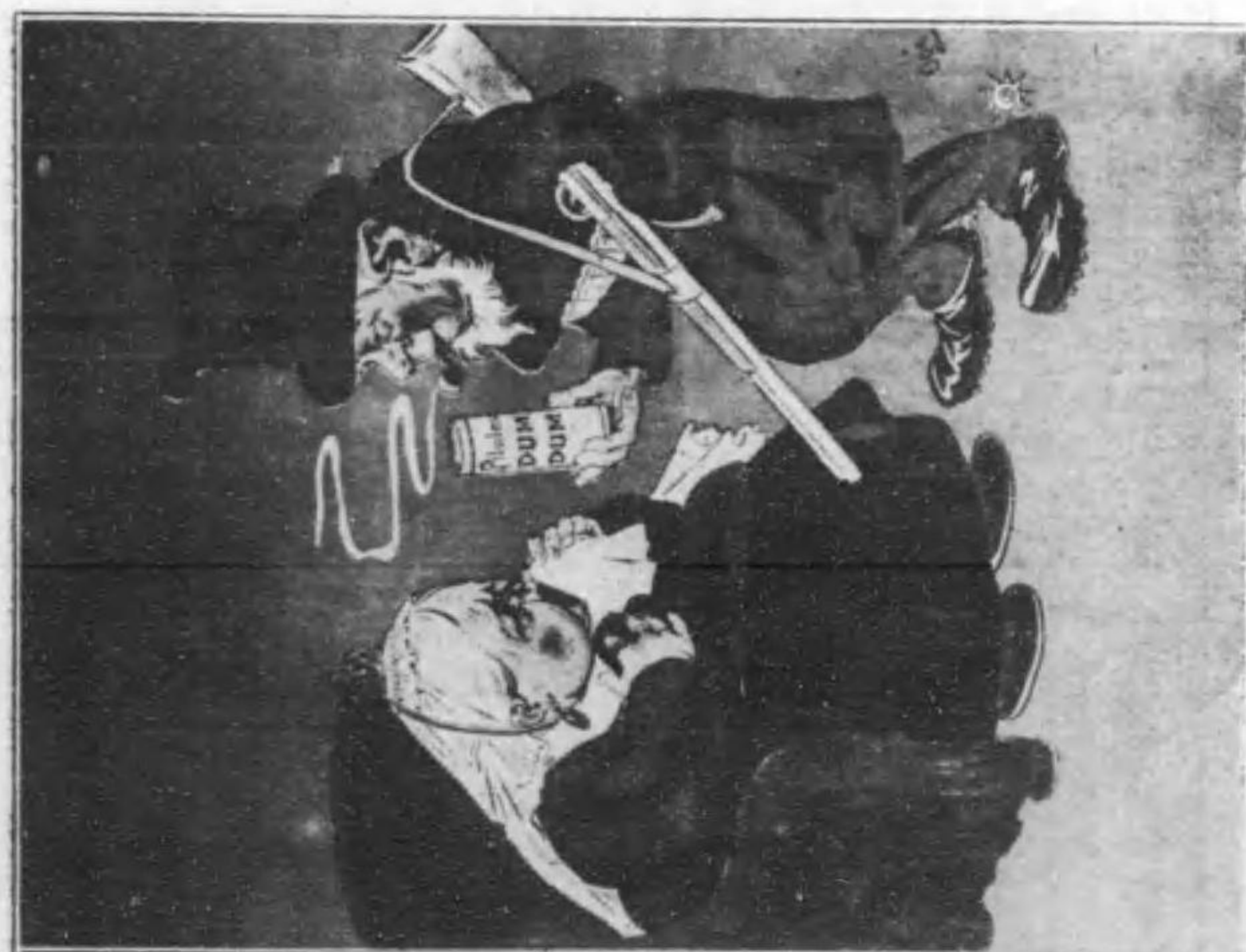
錠 丸 の 廣 告 (國 佛)