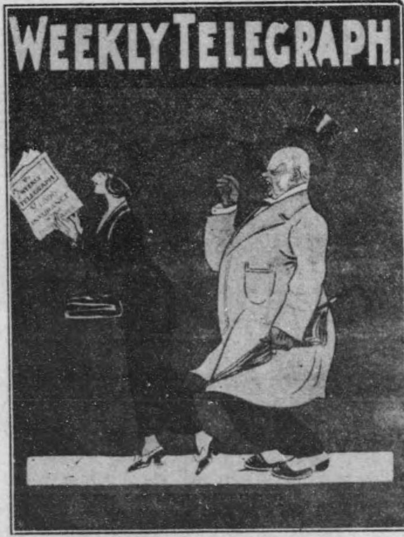
(國英) 告廣の誌雜刊週

屋外用ポスターの色彩は尤も注意を要す即ち遠方の距離より見て鮮明にして刺戟を興へ且つ褪色せざるものならざるべからず今其色彩を見るに尤も多きは黄地に黒又は赤にして之に次ぐを白地に緑、又は黒、青地に白地とす何れも強烈なる地色に反対色を用ひて文字繪畫を表すを見る、一例を挙げれば肉エキスの廣告に黄地に褐色を以て牛首を表はし上部に Who said 下部に Bovril の文字を紺青にて表はすが如き又は紺青地に白色の婦描き白色の卓掛に E.D.S. の三字を書き Satisfaction 上右部に Edwards soup desiccated を下部に書せるが如し。