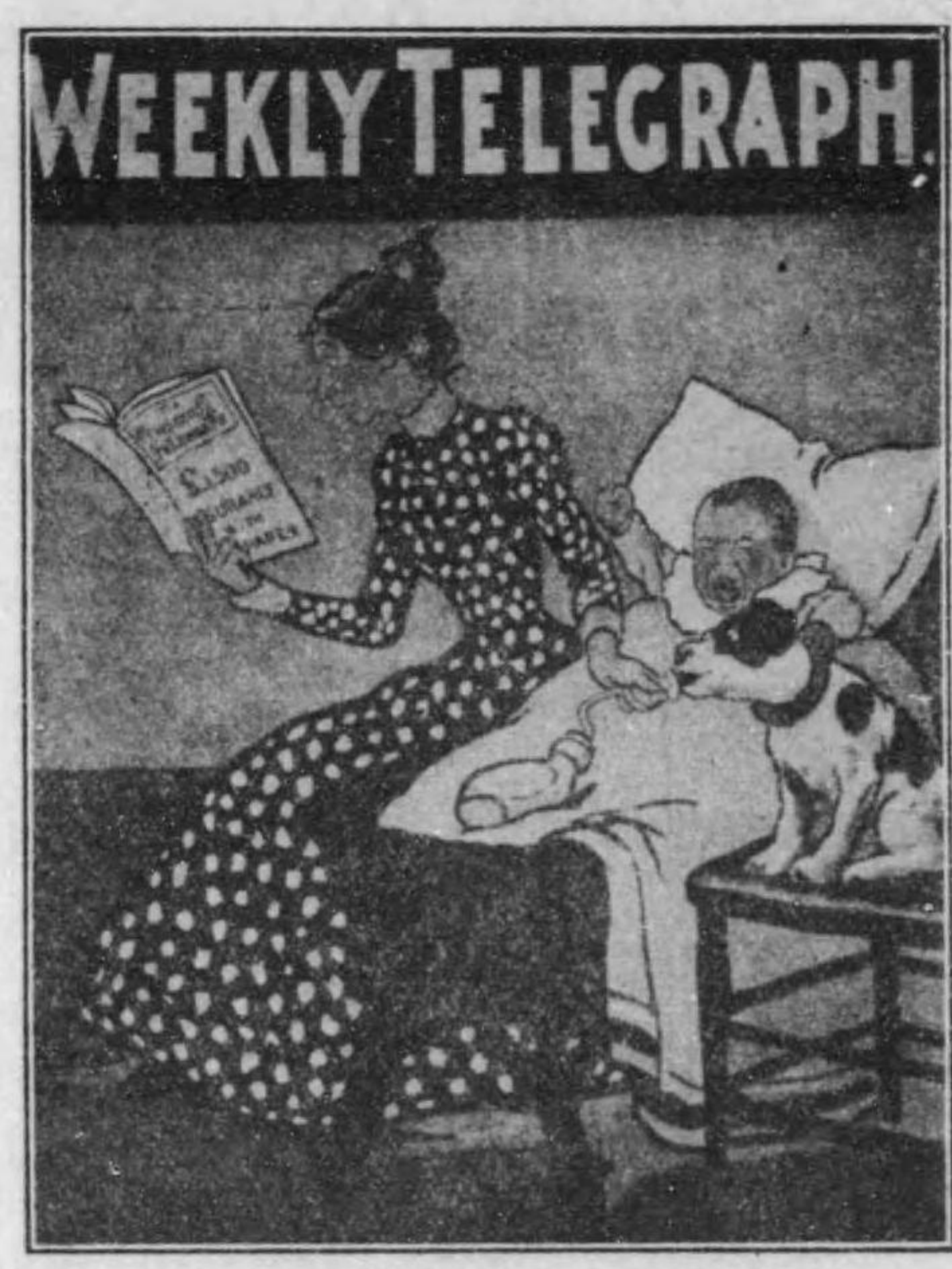
(國英) 告廣の誌雜刊週

ポスターの文字は繪畫と同じく管潔にして人の注目を惹くもの多し即ち其主要なるを示せば左の如し。