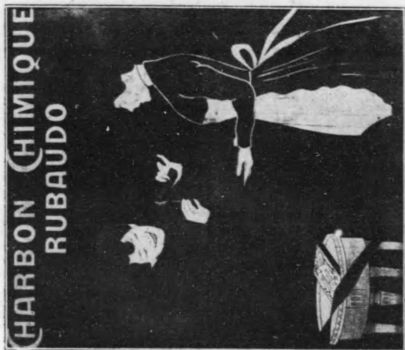
カ ー ボ ン の 廣 告 (國 佛)