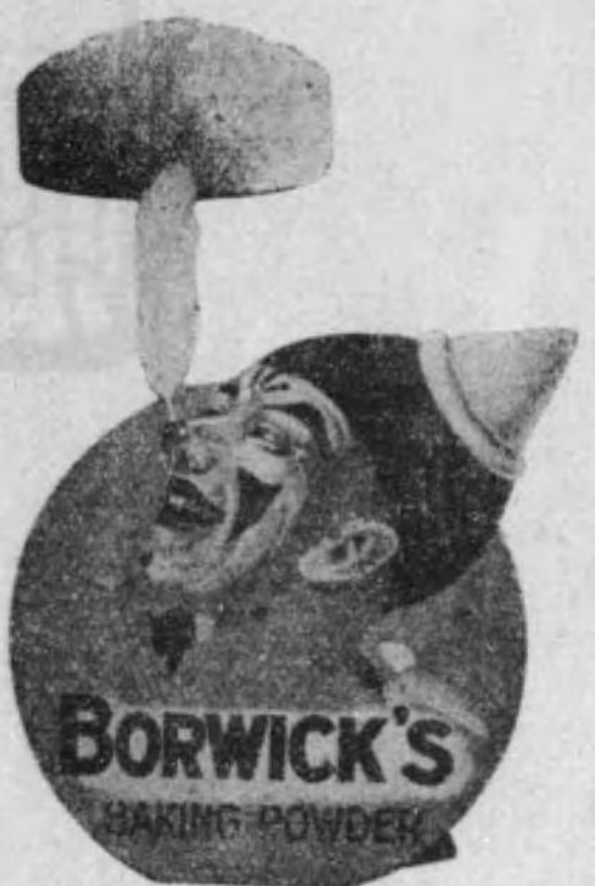
(國英) 告廣の粉しらくふ

料は出品者の負擔とす 一出品者は出品物に住所氏名營業名并に品名 (出品物)を記載したる書面を添付せらるべし 一本會は出品手数料及場所料等一切の費用を徴 收することなし 一本會縦覽時間は午前九時より午後四時迄とす 農商務省より貸與せられたるは英、佛二國の廣 告資料三百五十九點にして内英國の分二百九