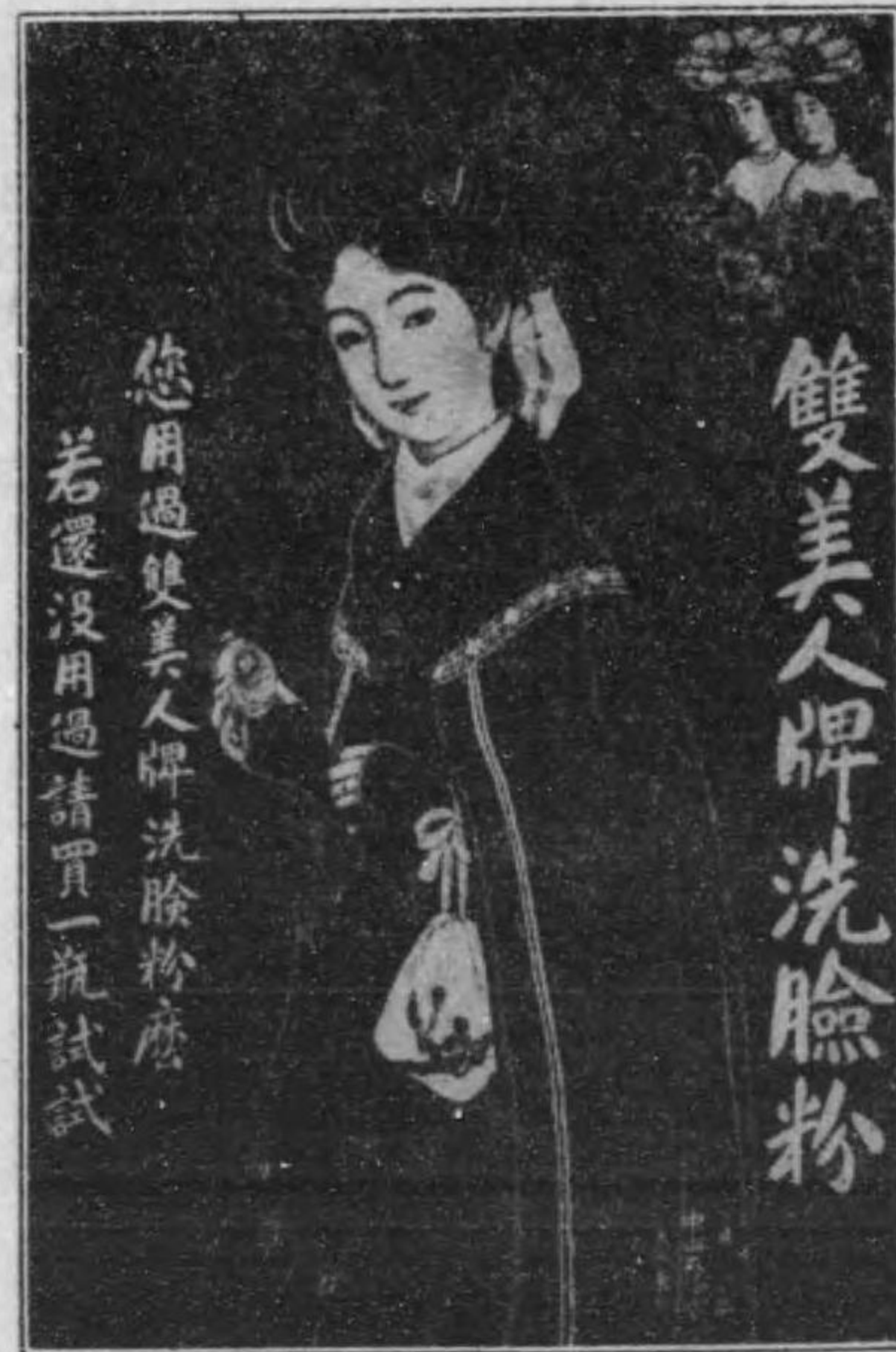
(邦本) 告廣の品粧化

室内用のポスターは屋外用の如く強烈なる色彩を用ひずして美觀を興へ裝飾用として室内に掲ぐるに足るもの多し印刷も屋外用のものに比して精巧なる石版刷又は寫眞版を用ゐたるものあり而して寸法も横二尺縦一尺五寸位のもの大部分を占む形狀は種々あり圓形のもの細長きもの杓子形のもの楕圓形のもの或は切抜を以て種々の形狀を表はし又は狀刺、カレンダーなどを兼ねたるものあり、用紙もボール紙にアート紙を張付けたる又はワニスを塗りたる等頗る美麗なるものあり、