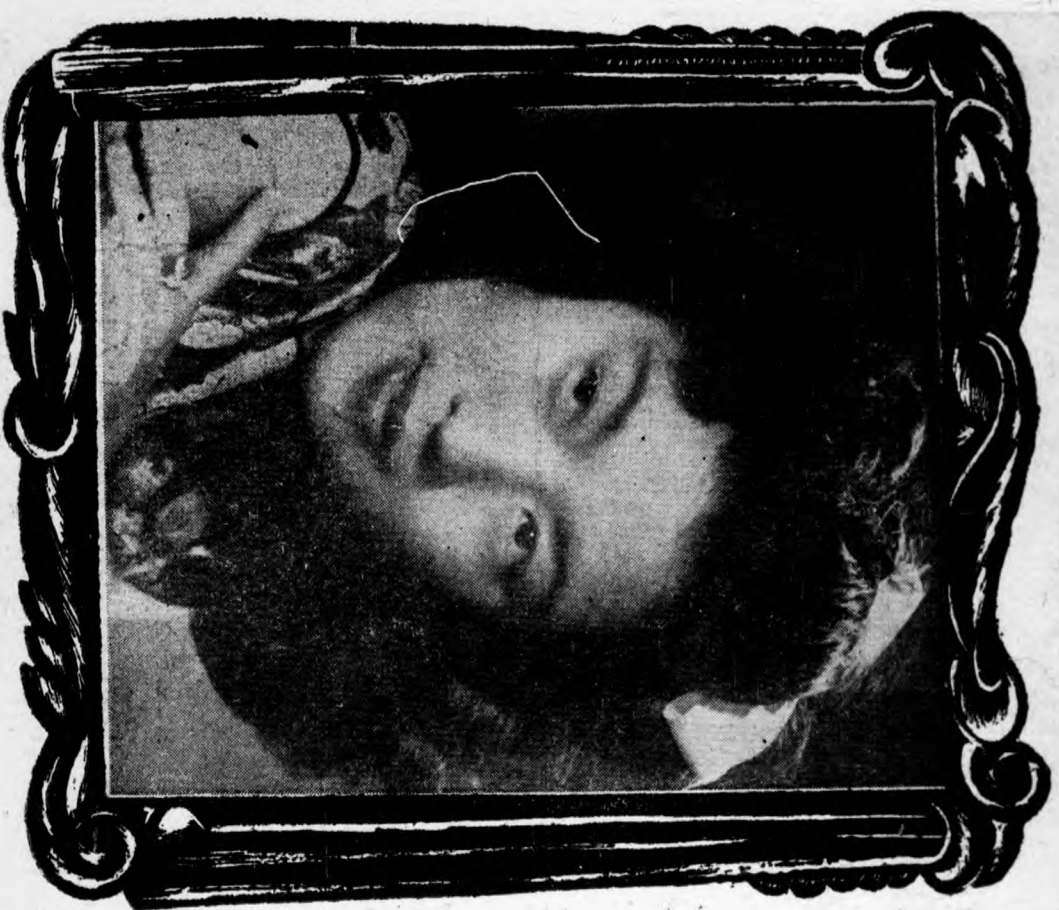
· 菲莎陽歐之頭碰燕燕陳與滬在 ·