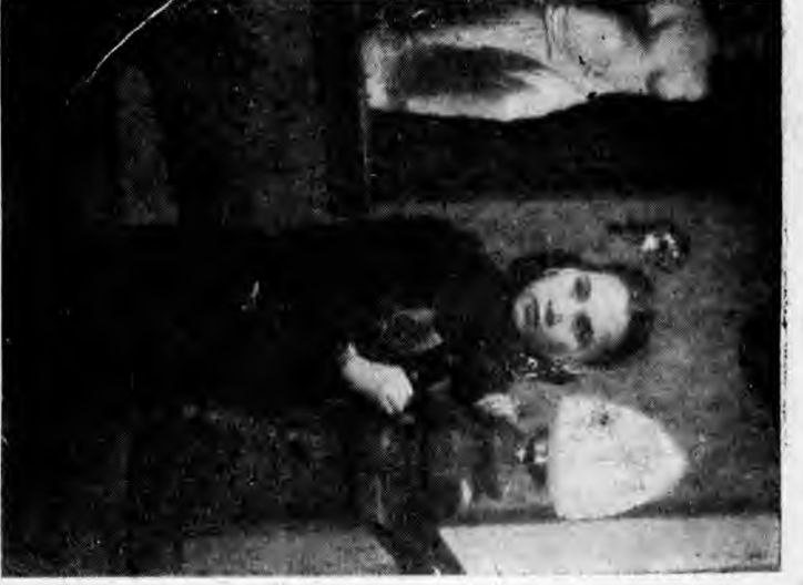
中「雲霓閣深」在燕陳與星女。