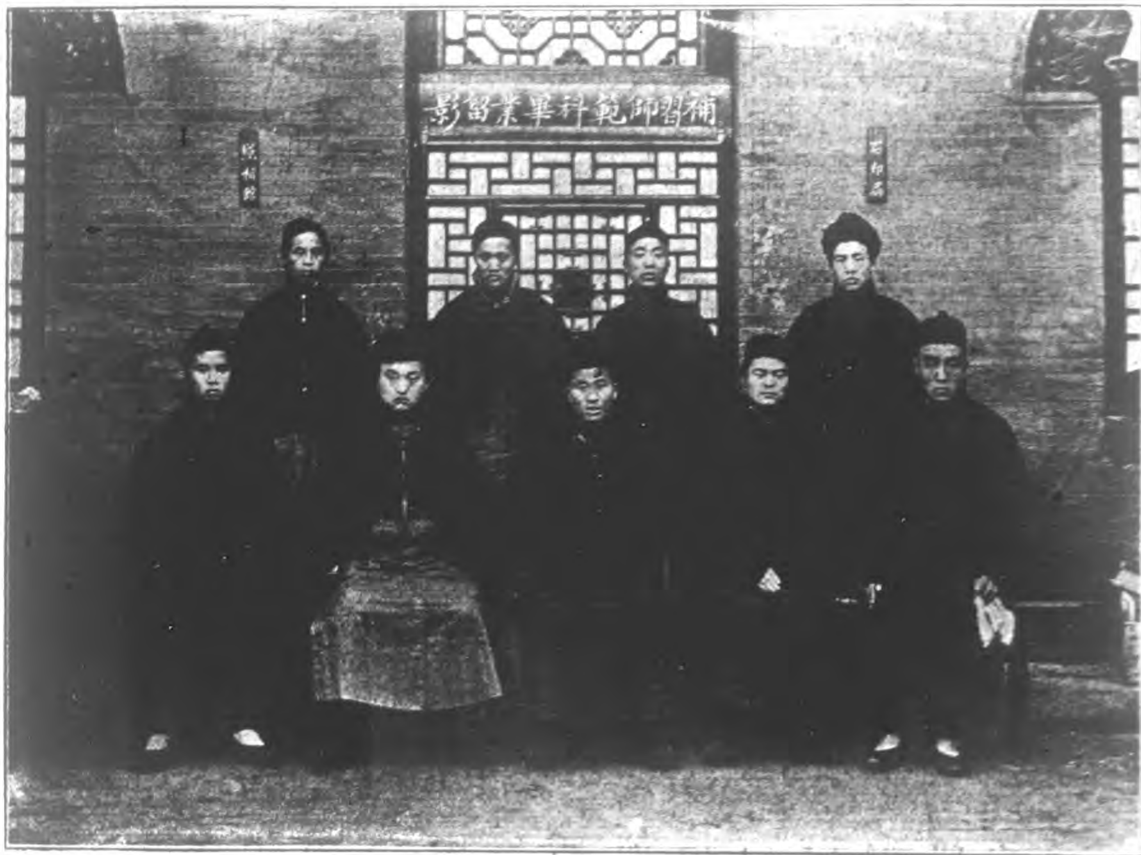
山西潞城補習師範科畢業生