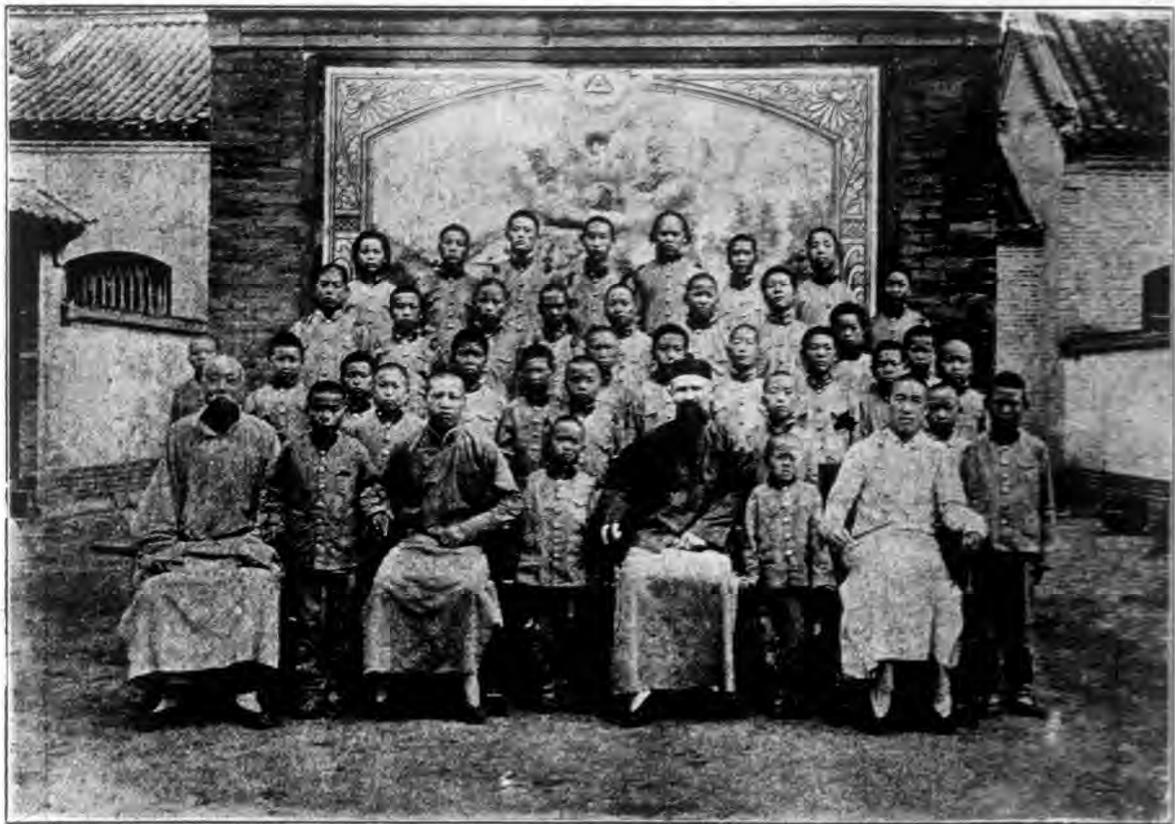
山東諸城天主堂聖加俾厄爾學校