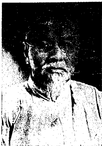
林 主 席 玉 照