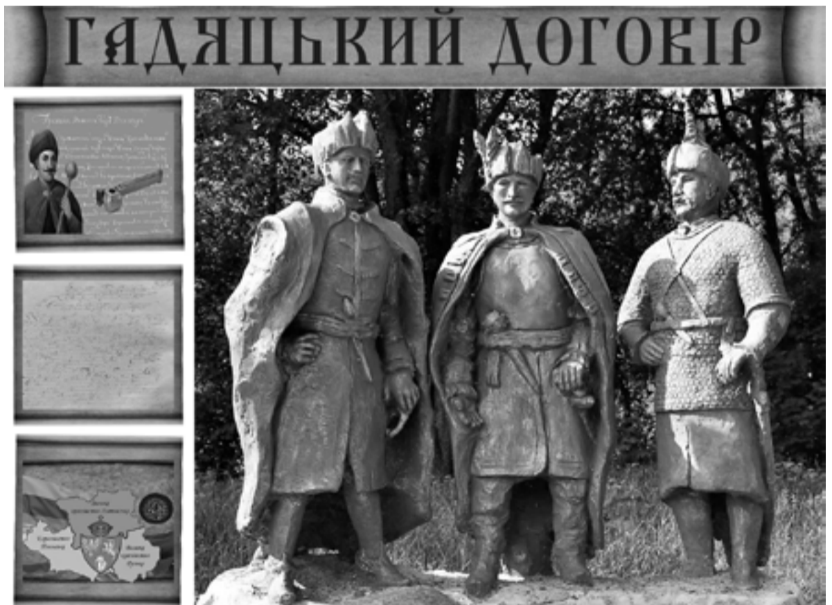
Скульптура авторства Вячеслава Мороза і Олександра Зозулі на ймовірному місці укладання Гадяцької угоди у селі Красний Кут

Чвари серед козацької старшини та вмілі підступні дії московської розвідки ніяк не давали українській державності зміцнитися, а Гадяцькому договору втілитися у життя.