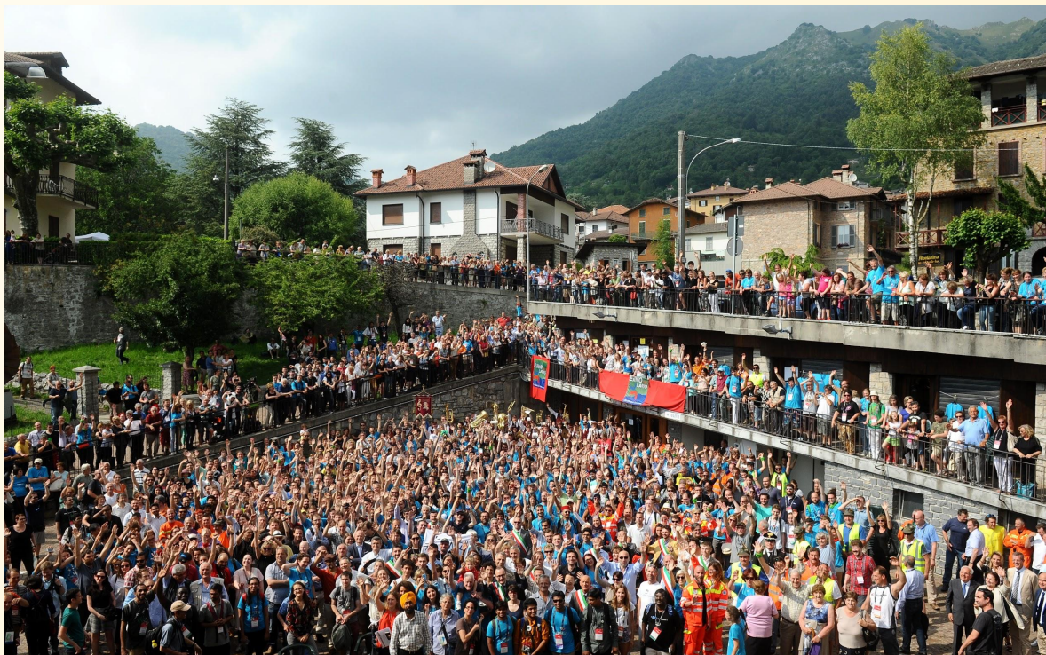
Wikimania 2016 Group Photograph. Esino Lario.