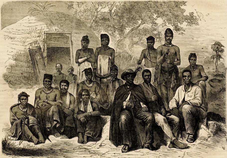
Предводители кафров съ ихъ жонами и святой.

Юг и север Африки представляют между собою чрезвычайные различия. На север идут караванные пути; Инд и Нигер составляют самый удобный водный путь, а магистратство представляет государственную и племенную