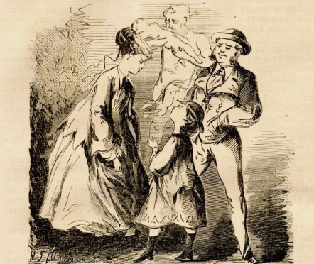
Дочь. — Мама, что это за скверный такой старик, который дѣтей кушает? Мать. — А онъ кушаетъ только тѣхъ, которые капризничаютъ... вотъ и тебя надо кушать, если будешь плакать. Дочь. — Я вамъ не боюсь, я негу зубокъ ѣтъ... я вышла, какъ ты вечеромъ показывала этому дядѣ его зубы, которые онъ кушалъ у Ватейкина.