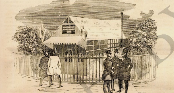
Пеканья въ Александринскомъ скверѣ.

горшковъ изъ бѣлой жести, съ хорошо запирающенся крышкою и удобною рукою. Употребленіе аппарата состоитъ въ слѣдующемъ: горшокъ ставится на огонь и когда содержимое въ немъ суну, или другое кушанье, прокипитъ до 15-ти минутъ, горшокъ вдвигается въ вытолчанный ящикъ, который и закрывается. Волокно, дурной проводникъ тепла и горшокъ продолжаетъ въ своей оболочкѣ кипѣть еще нѣсколько времени, такъ что его можно употреблять по желанию. Черезъ пятнадцать часовъ, кушанья, приготовленные въ этомъ аппаратѣ, сохраняютъ еще температуру въ 50°. Горшокъ вытиски въ 15 минутъ и черезъ пять часовъ можетъ быть употребленъ въ пищу. Говядина и бобы тоже варятся 15 минутъ и употребляютъ черезъ четыре часа. Сухія овощи кипятятъ 15 минутъ и употребляютъ послѣ трехъ часовъ. Молочный рисъ и тому подобное кипятятъ 10 минутъ и употребляютъ черезъ три часа. Картофель варятъ только 8 минутъ и употребляютъ черезъ часъ. Эта метода варенья сберегаетъ много тепла и весьма пригодна во время путешествій. Эти аппараты разнакъ величина получаются у Копа, придворнаго поставщика въ Берлинѣ. Аппаратъ былъ на парижской всемірной выставкѣ.