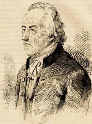
П. А. Дмитревскій.