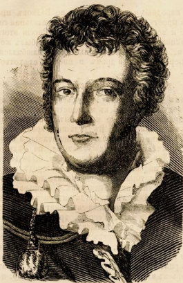
А. С. Яковлевъ.

тогда домъ Кушелева (теперь главный штабъ), часть котораго явилась театральная дирекція для помещенія тамъ немецкаго театра: директоромъ его былъ Кюнебу, а потомъ Кампенаузенъ, и въ немъ давались самыя патриархальные спектакли; зрители, во время представленій, вѣли кофе, а зрительницы вѣзали чучки. Но какъ нѣмцы въ почтовые дни: вторникъ и пятницу, не играли, то Шаховской устроилъ въ эти дни представленія своей молодой труппы. Для нея-то нуженъ былъ ему Бранскій, потому что у него въ школѣ не было молодыхъ любовниковъ.