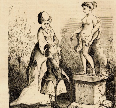
— Маман, отъ чего это прежнія дамы не носили на живопись, ни швей- фовъ, ни шпильковокъ? Отъ того, что онѣ были глупыя, еще необразованныя... у нихъ не было столько такихъ магазинъ, какъ на Нескомъ, но даже и такихъ ла- вокъ, какъ у насъ въ Волчанскѣ.