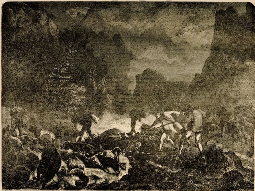
Переправа черезъ рѣку на ходуляхъ.

Скорѣе умеръ Яковлевъ, и Брянскій сдѣлался его преемникомъ. Борьба была трудна, но только по причинѣ привычки публики къ Яковлеву, который въ послѣдніе годы игралъ очень слабо, отъ образа своей жизни. Чтобъ побѣдить этотъ предрасудокъ, Брянскій началъ съ двухъ лучшихъ и сильнѣйшихъ ролей Яковлева: Юданъ въ «Гевоніи»