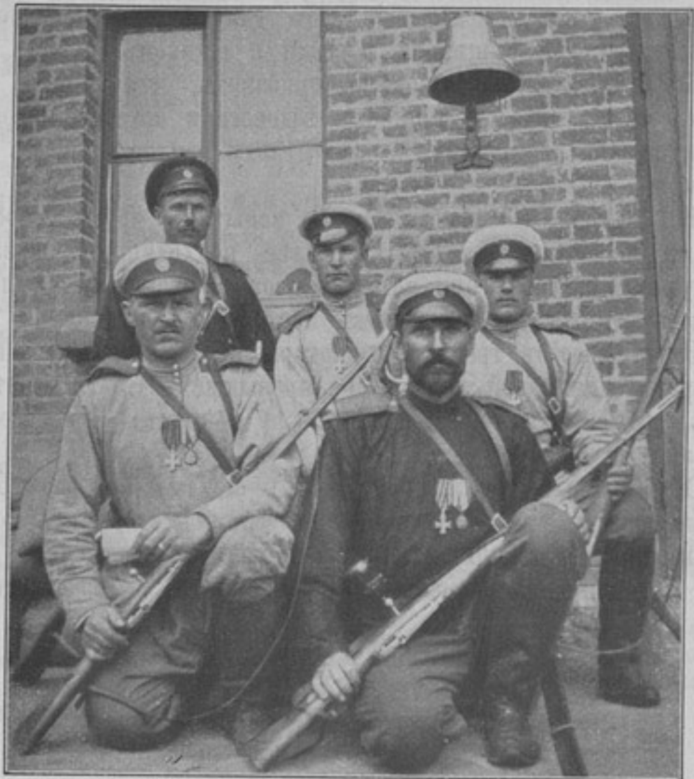
Нижніе чины кавалеры пограничной стражи, около ст. «Турчиха» Кит. ж. д. поймавшіе Японскихъ шпионовъ-офицеровъ, переодѣтыхъ монголами (собств. корресп.).

во 2-хъ, даже при одинаковой теплотѣ, онъ сидитъ красиво, не такъ, какъ теплушка, которая, если у нижняго чина есть какой-нибудь физическій недостатокъ, не только его не скрываетъ, а, напротивъ, усугубляетъ точно также, какъ нашъ мундиръ. Все сказанное говорить въ пользу введенія полушубка вмѣсто теплушки, и, кромѣ того, если ввести полушубокъ, то онъ для казака будетъ стоить не дороже теплушки на томъ основаніи, что у казака есть свои овцы, слѣдовательно, ему придется заплатить только за дубленіе и за шитье.