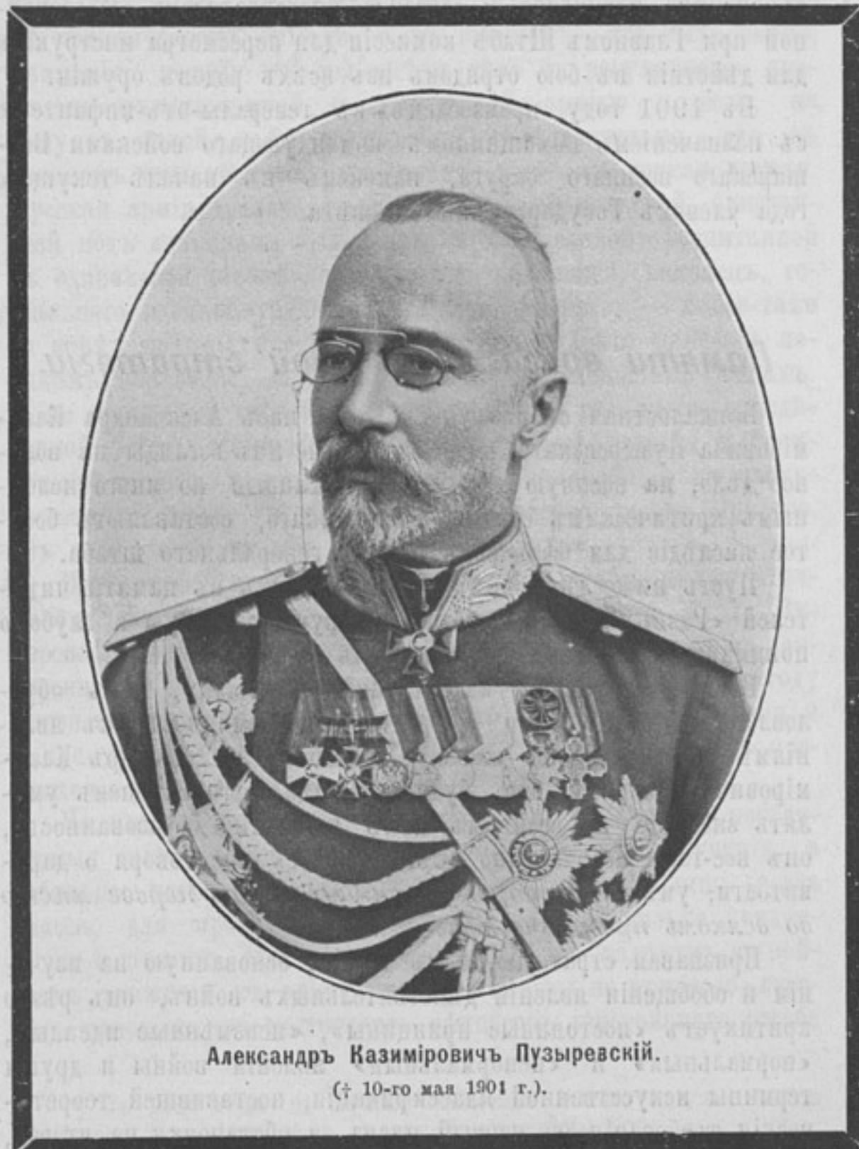
Александръ Казиміровичъ Пузыревскій. († 10-го мая 1904 г.)

Курсъ дисциплинарнаго устава и военно-уго- ловныхъ законовъ для полковыхъ учебныхъ командъ и строевыхъ унтеръ-офицеровъ. Составилъ поручикъ Рыминскій . Изданіе 2-е , исправлено и дополнено подъ редакцію подполковника военно-судебнаго вѣдомства Вишнякова . . . . . 25 к. Родство Россійскаго Императорскаго дома съ иностранными монархами . . . . . 60 к.