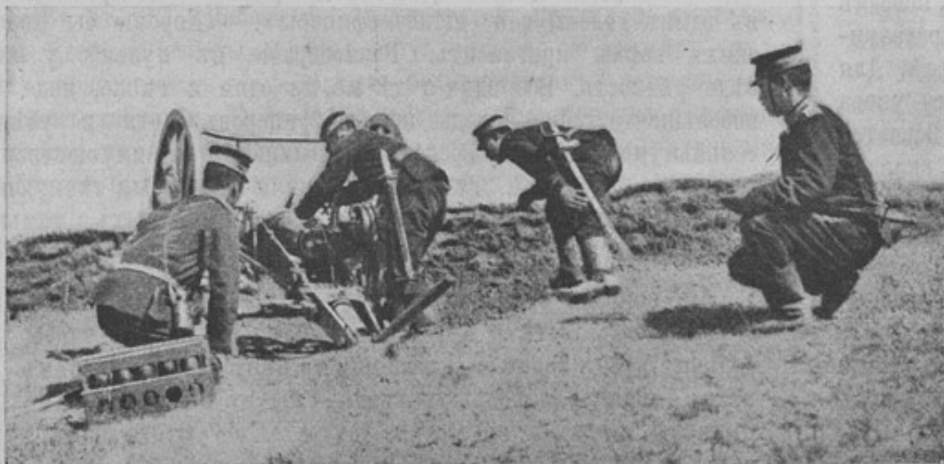
Японское полевое орудіе въ дѣйстви.

Если же ввести полушубокъ, то, конечно, за него заплатить нужно дороже, что на первый взглядъ покажется невыгодно; но, пустивъ его въ дѣло, сразу обнаружится все его преимущество. Во 1-хъ, онъ крѣпче: нѣкоторые нижніе чины имѣютъ полушубки и носятъ ихъ всѣ три года, и онъ настолько еще крѣпокъ, что они, идя домой, не продаютъ его, а берутъ съ собой, говоря, что онъ имъ пригодится еще дома,