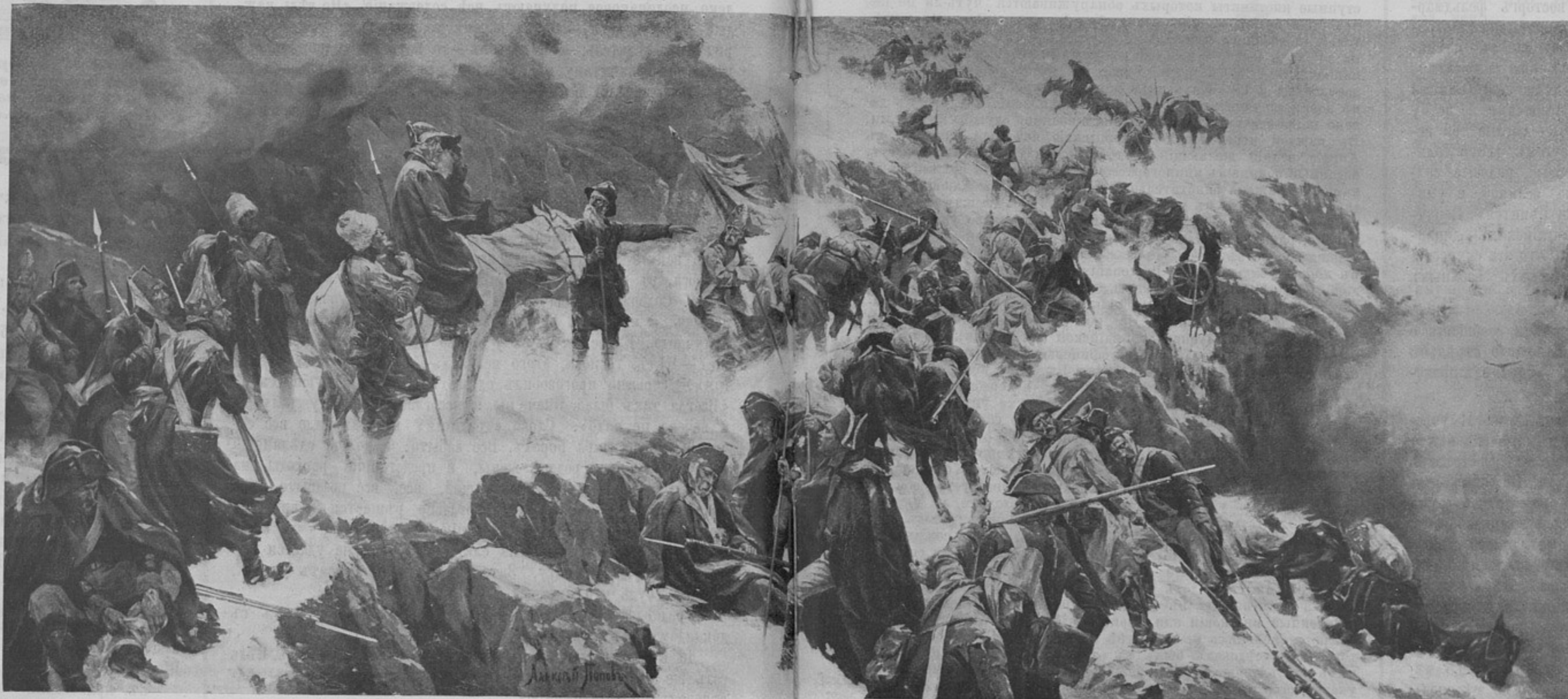
Отъ Альтдорфа къ Роштоку (къ ст. «Памятникъ Швейцарскаго похода Суворова»).

Утромъ меня разбудили въ четыре часа. Наскоро одѣв-