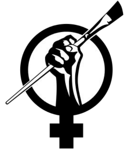
Wikidonne logo, Maria-beatrice-wk, CC BY SA 4.0