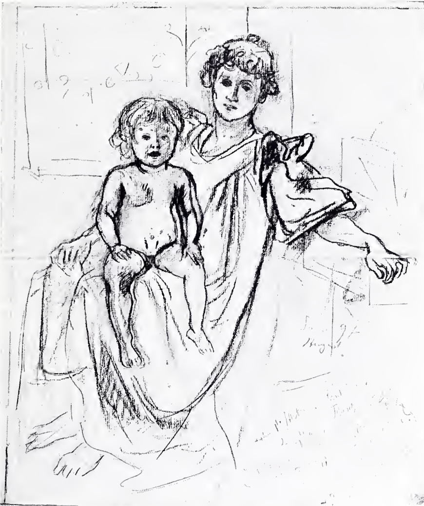
MUTTER UND KIND