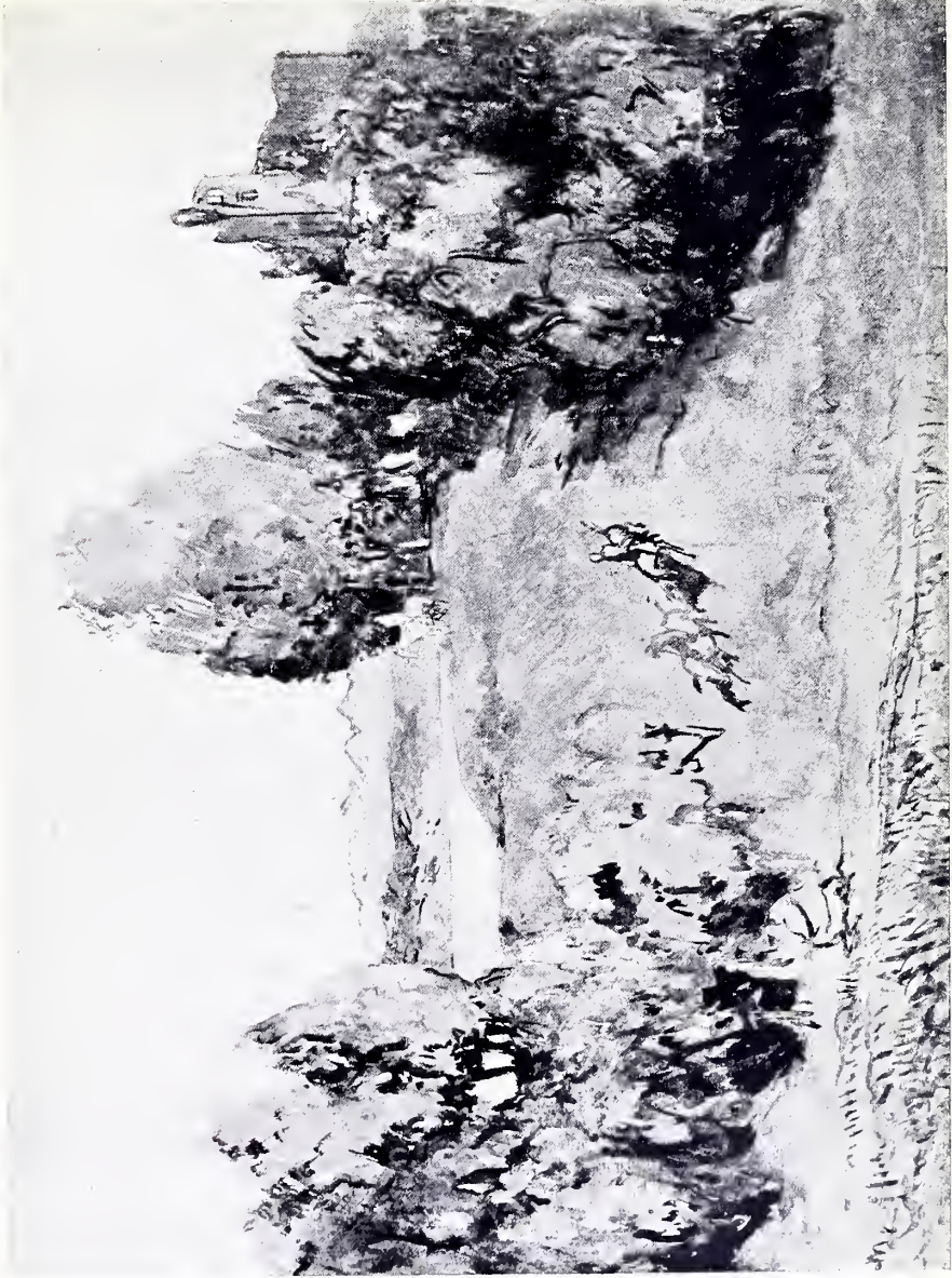
LANDSCHAFT MIT HIRSCHJAGD