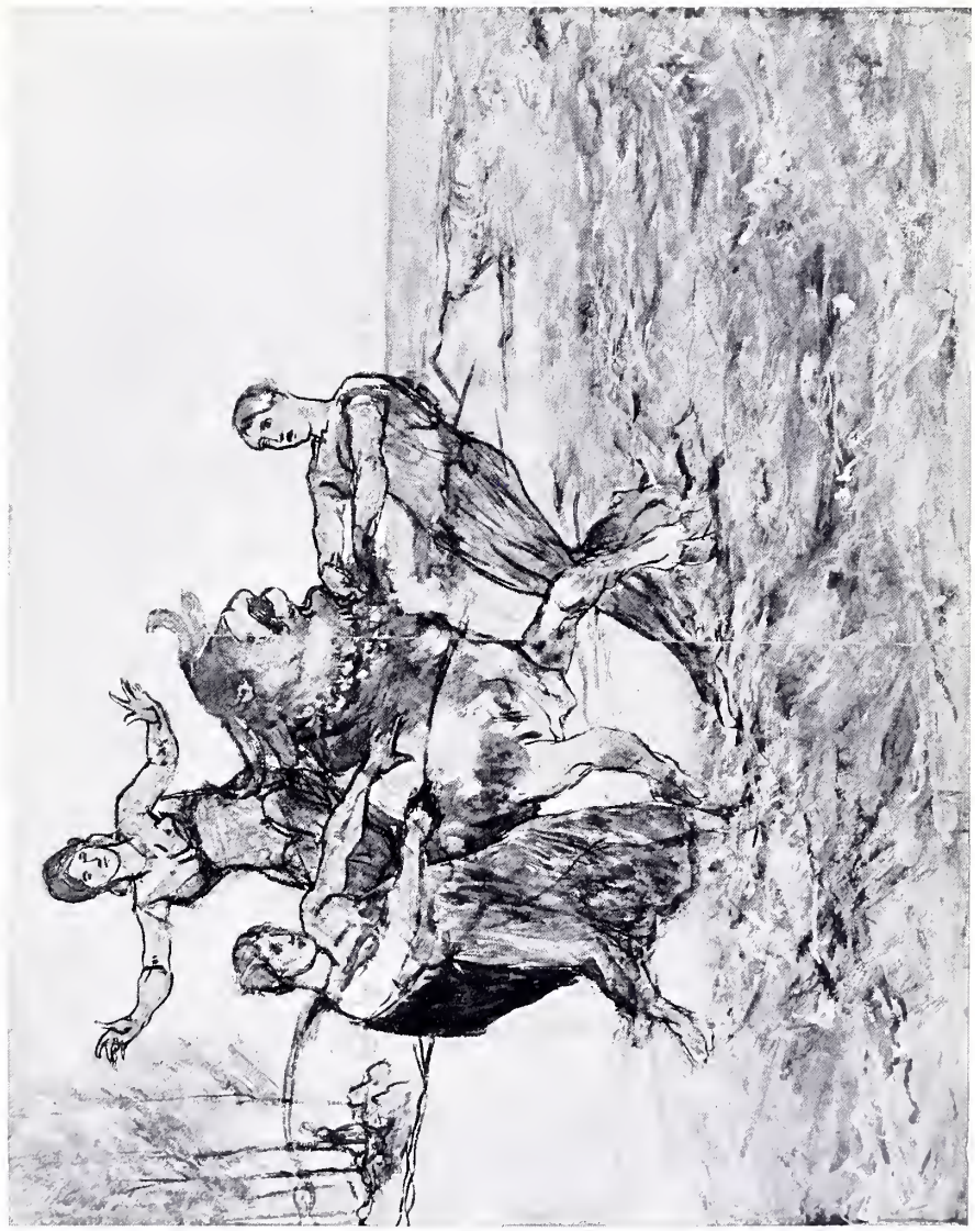
ENTFÜHRUNG DER EUROPA