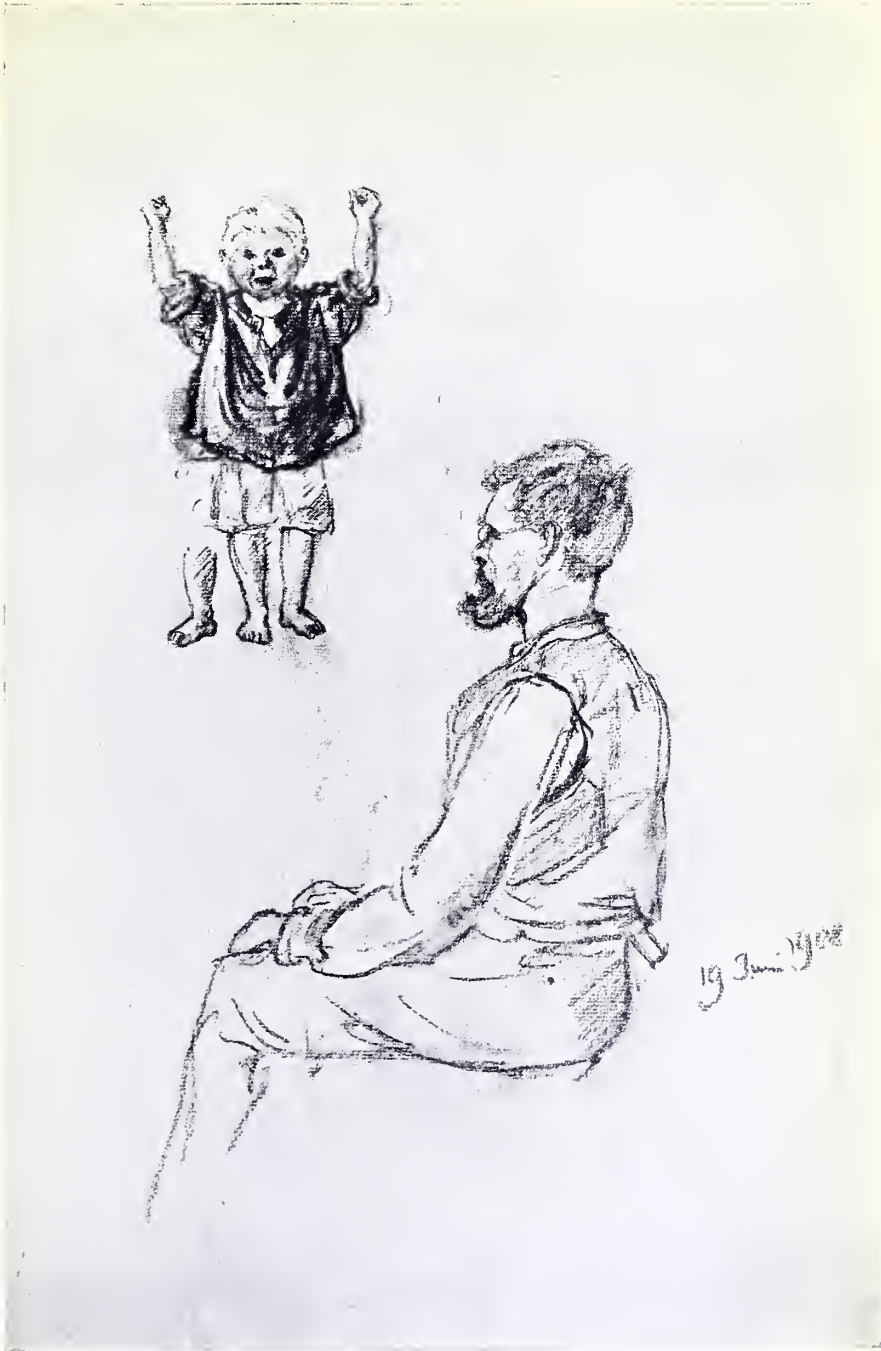
STUDIE ZUR RADIERUNG „RÜCKKEHR“