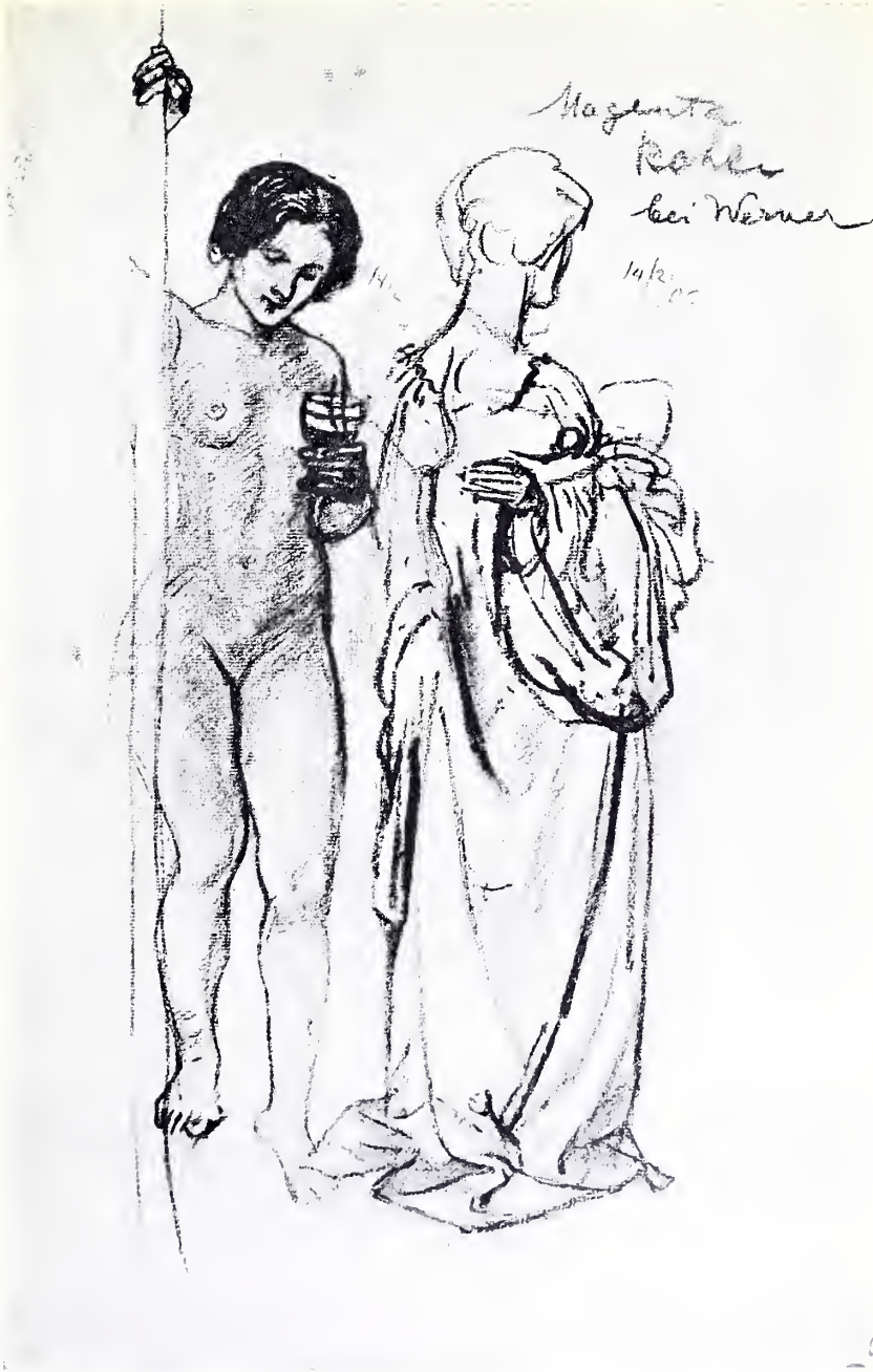
STUDIE ZU DEN „PENATEN“