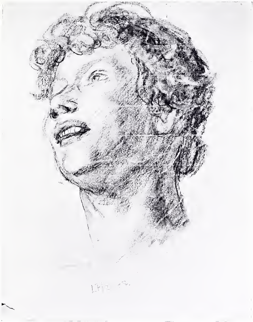
STUDIE ZUR „WALPURGISNACHT“