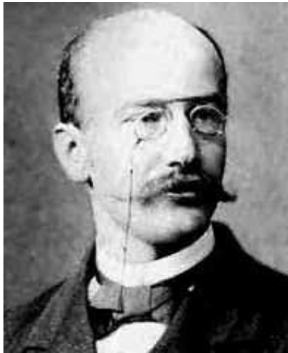
Ferdinand von Lindemann (1852-1939)

BEMERKUNG 10.8. Eine komplexe Zahl z \in \mathbb{C} ist genau dann algebraisch, wenn es ein von 0 verschiedenes Polynom P mit rationalen Koeffizienten und mit P(z) = 0 gibt. Durch Multiplikation mit einem Hauptnenner kann man für eine algebraische Zahl auch ein annullierendes Polynom mit ganzzahligen Koeffizienten finden (das allerdings nicht mehr normiert ist). Eine rationale Zahl q ist trivialerweise algebraisch, da sie Nullstelle des linearen rationalen Polynoms X - q ist. Weiterhin sind die reellen Zahlen \sqrt{q} und q^{1/n} für q \in \mathbb{Q} algebraisch. Dagegen sind die Zahlen e und \pi nicht algebraisch. Diese Aussagen sind keineswegs selbstverständlich, die Transzendenz von \pi wurde beispielsweise von Ferdinand von Lindemann 1882 gezeigt.