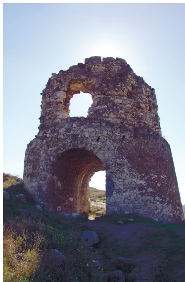
Фортеця Каламіта в Інкермані поблизу Севастополя

методик геомеханіки й сучасного підземного будівництва ще чекають свого часу.