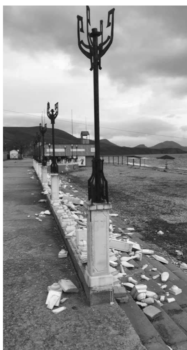
ФОТО З ВІДРИТТЯ ДЖЕГЕЛ

р. завершити всі роботи, поки що все виходить. Що стосується фінансування – йдеться про мільярди».