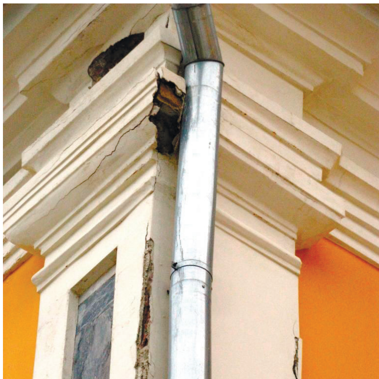
Наслідки ремонту 2017 року, лютий 2019 року

тету з охорони культурної спадщини підрядник розпочав роботу з підготовки документації. Цього року робота триває і виходить на виконання проектно-вишукувальних робіт. Коли вони будуть завершені і пройдуть експертизи, буде зрозумілий обсяг робіт і їхня вартість. Тоді ми повинні будемо встигнути в бюджет на 2020 рік це закласти. На даний момент документація готується так, щоб капітальні ремонтно-відновлювальні роботи провести в двох наших будинках і побудувати фондосховище. А потім поставити питання, в якому розмірі це