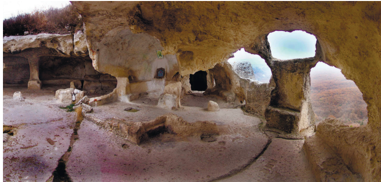
Печерне місто Ескі-Кермен

Донедавна «печерні міста» вважалися однорідними й одночасними пам'ятками. Це породжувало цілу низку непорозумінь й облудних історичних висновків. Слід зазначити, що вони — найменш досліджені культурно-археологічні об'єкти на території Криму, а науково-технічні розвідки, залучення дослідницьких