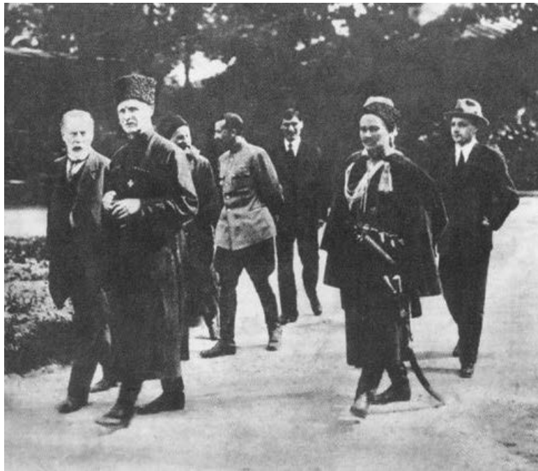
Павло Скоропадський і Федір Лизогуб, 1918 р.

Так само, як проти татар, Кримський крайовий уряд боровся й проти українського руху. Одразу після одержання влади він почав запроваджувати політику, спря-