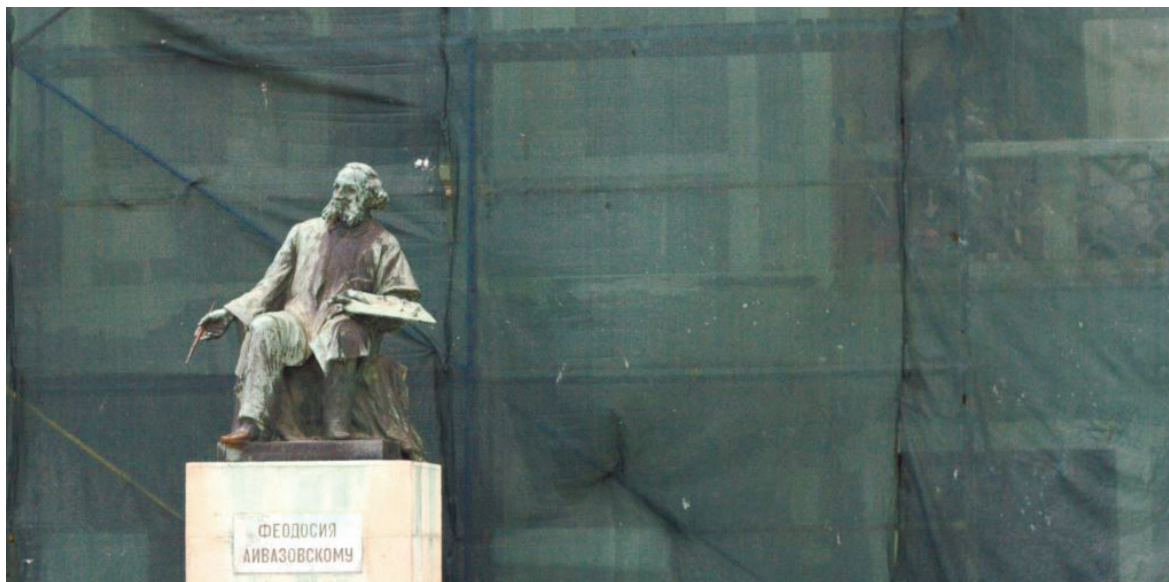
Під час ремонту фасаду галереї, 2017 рік