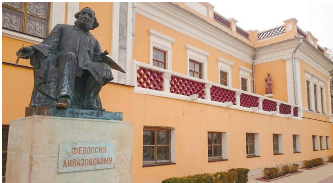
Галерея ім. І. Айвазовського до ремонту

Україна неодноразово повідомляла про грубі порушення в діяннях РФ щодо української культурної спадщини. Попри це, всупереч міжнародному й українському законодавству, Росія вивозила роботи з галереї Івана Айвазовського з українського півострова для тривалого експонування, не спитавши про це нікого. Так, у 2016 році 38 кар-