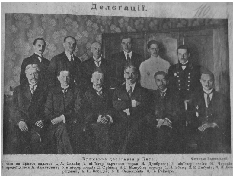
Члени кримської делегації на переговорах у Києві про приєднання до України

мовану на відрив півострова від України. Усі заходи Української Держави ігнорувалися. Було розпочато переслідування українських газет, мови, громад та ін. Так, було заборонено приймати навіть урядові телеграми з Києва, складені українською мовою 1 .