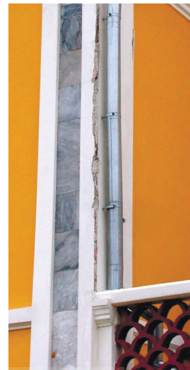
Наслідки ремонту 2017 року, лютий 2019 року

Натомість вражає і заявлене кримською владою майбутнє перевтілення галереї, перебудова якої, як уже зазначалося, триватиме до 2022 року. За словами «глави» Криму Сергія Аксьонова, у Криму в найближчі два роки планують завершити роботи щодо створення єдиного Музейного кварталу на базі Феодосійської картинної галереї Айвазовського, на півострів направлені провідні фахівці з Третяковської галереї Москви для експертної оцінки фондів музею і розробки концепції його реставрації. Перше, що потрапить під зміни, – зали музею. Планується, що після оновлення галерея ім. Айвазовського стане головним музеєм Криму.