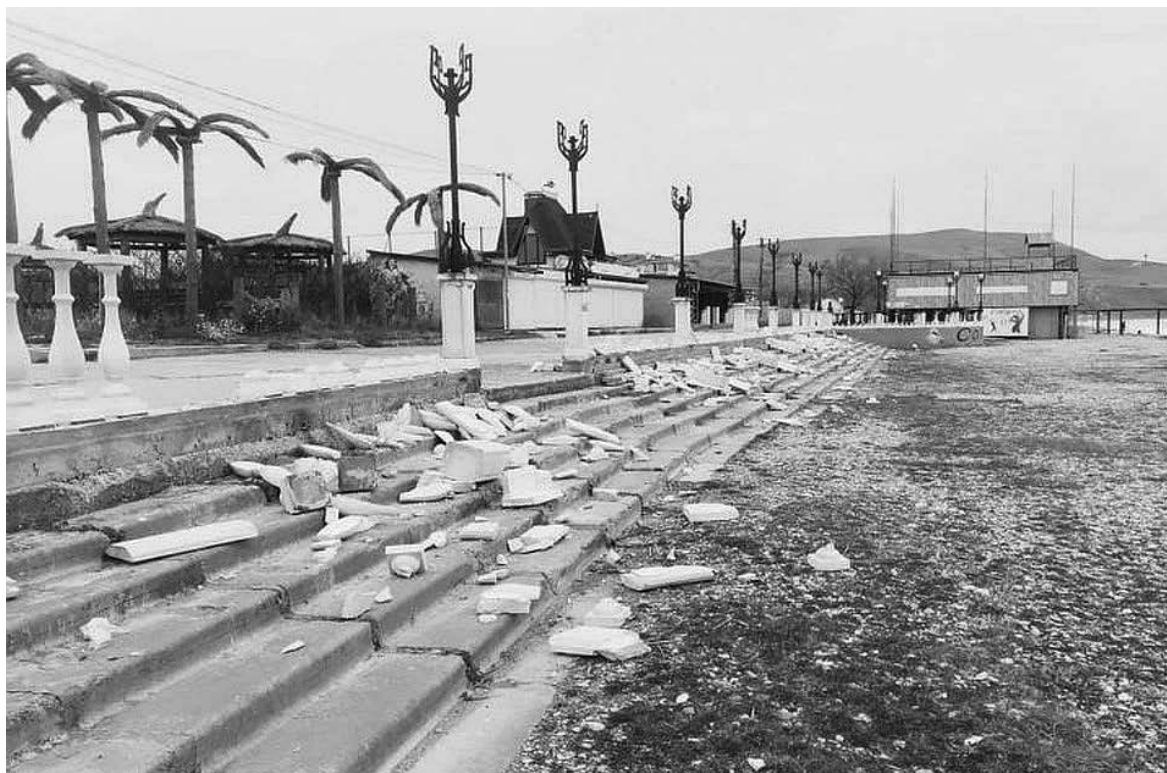
Такий вигляд має набережна Коктебеля нині