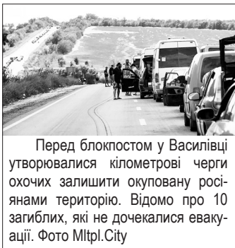
Перед блокпостом у Василівці утворювалися кілометрові черги охочих залишити окуповану росіянами територію. Відомо про 10 загиблих, які не дочекалися евакуації.

Потім з Бердянська виїжджала моя тітка з онуком. І теж розповідала страшні речі. Вони в автобусі підхопили «корону» і, коли приїхали до Польщі, злягли з температурою. До того ж наклався стрес. Тому хвороба у них проходила дуже важко.