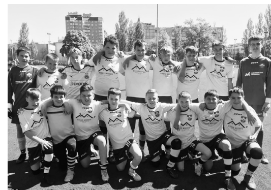
Інф. Макарівської селищної ради

Наші перемоги ще попереду! Віримо в команду!