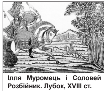
Ілля Муромець і Соловей Розбійник. Лубок, XVIII ст.

Можливо, сталося це в часи Західних походів Київського князя Володимира Святославича. В першій половині 980-х років він приєднав «Червенські городи», включно з Краковом, до Русі. російський історик Василь Татищев писав про цю подію так: «пішов Володимир на польського князя Мечислава за Віслою». Праця Татищева «Історія російська з найдавніших часів» є унікальною тому, що він користувався найдавнішими літописами, що збереглися у глухих монастирях старовірів. Деякими з цих літописів, ймовірно, міг користуватися сам Нестор (пізніше, під час боротьби зі старовірами, усі вони або пропали, або були знищені).