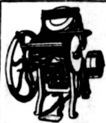
此種機器乃由外國製造之印刷機也