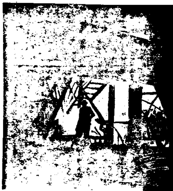
作 方 君 攝