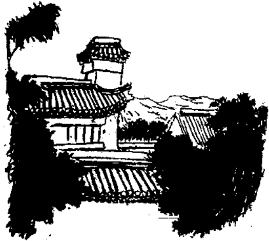
新豐樹老 籠明月 長生殿詩 鎖苦昏