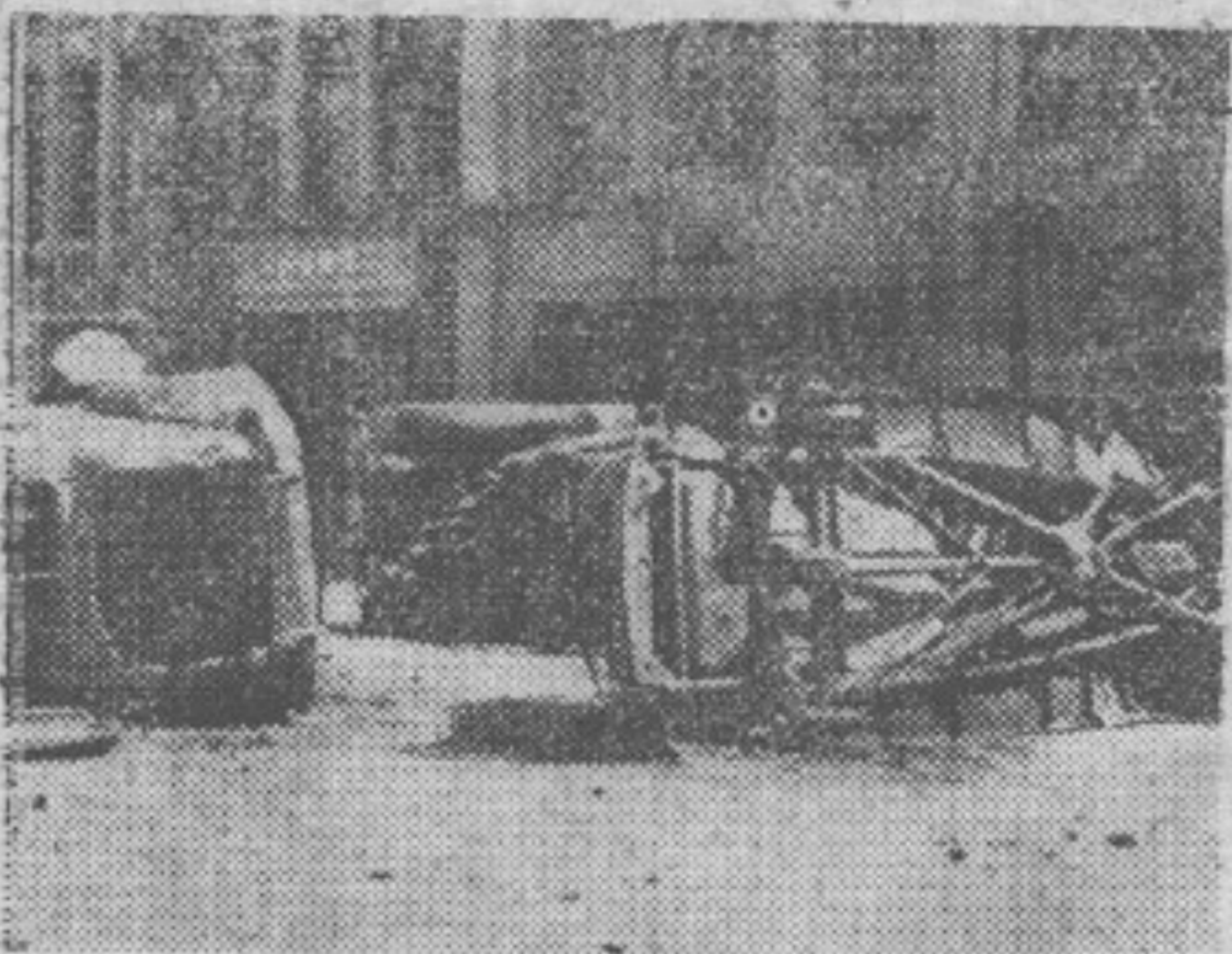
(攝厚存黃)車汽小人私的毀焚徒暴被