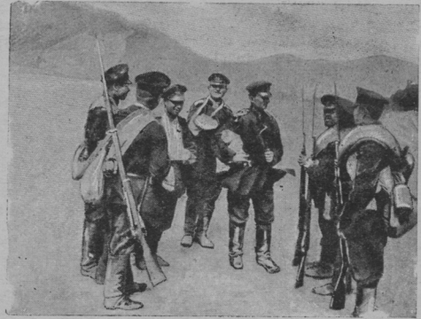
Легко раненые стрѣлки 12-го восточно-сибирского стрѣльковago полка рассказываютъ вѣстрѣчнымъ однополчанамъ о боѣ у Хайчена.

(Къ статьѣ на стр. 276).