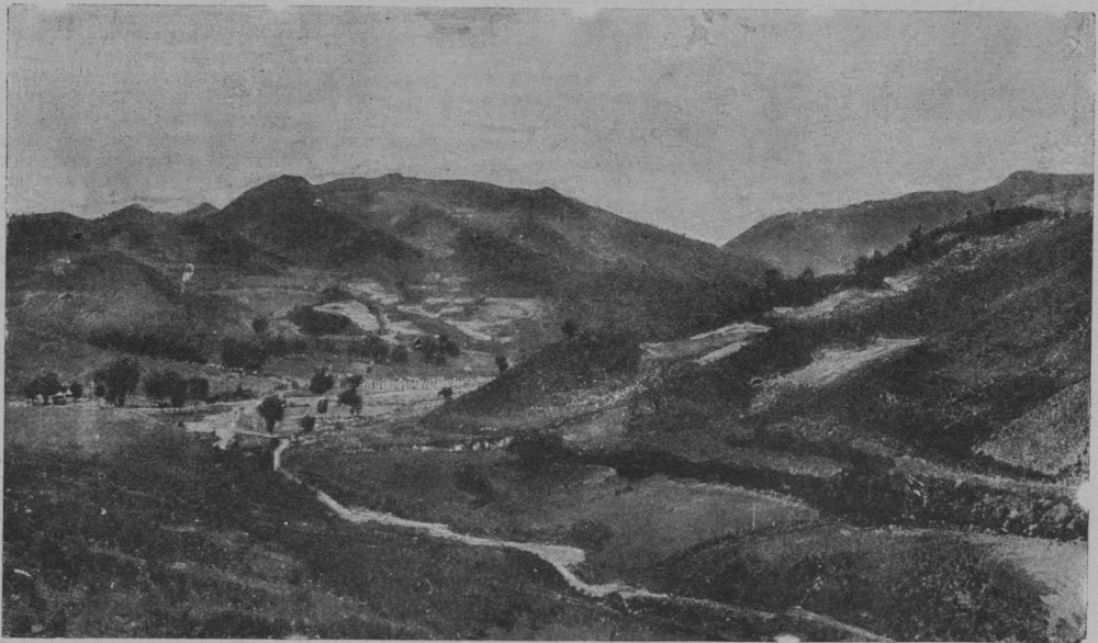
Видъ съ 1-ой батареи на расположеніе восточнаго отряда вблизи Ляояна.

Такъ какъ врачъ, который будетъ завѣдывать амбулаторіей, долженъ быть хорошо практически знакомъ съ гипнозомъ, то, въ случаѣ неимѣнія такихъ врачей, губернской