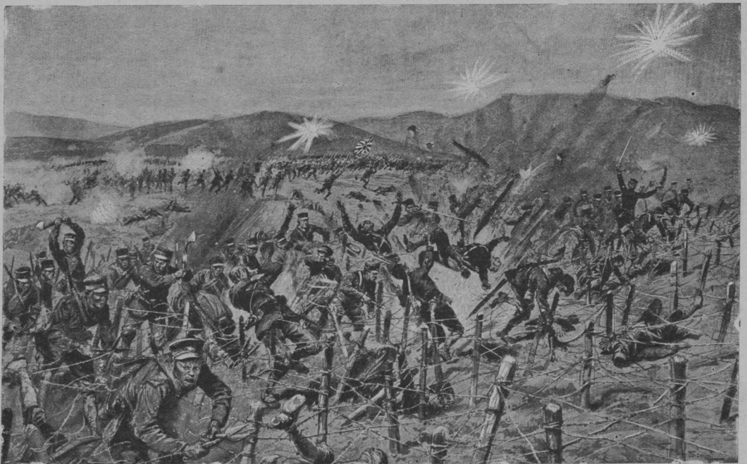
Борьба японцевъ съ проволочными заграждениями во время штурма порть-артурскихъ укрѣпленій. Набросокъ „L'Illustration“.