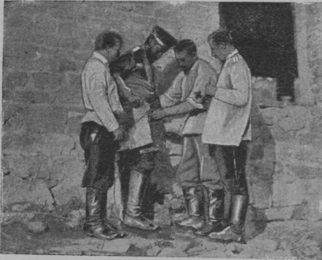
Врачи 24-го восточно-сибирского полка перевязывают раненого унтер-офицера вблизи мѣста боя.

Съ фотографій нашего корреспондента поручика В. Апухтина, присланныхъ намъ съ театра войны. (Къ статьѣ на стр. 276).