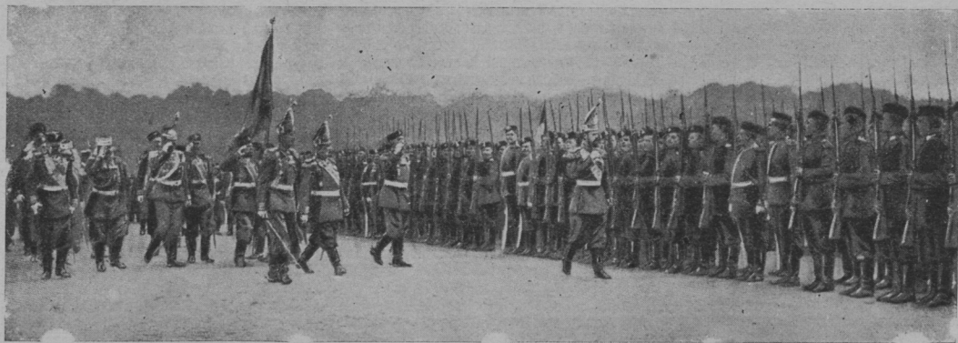
Полковой праздникъ лейбъ-гвардiи павловскаго и 198-го александроневскаго полковъ 30-го августа въ С.-Петербурѣ. Его Императорское Величество Государь Императоръ изволилъ здороваться съ александроневскимъ полкомъ.