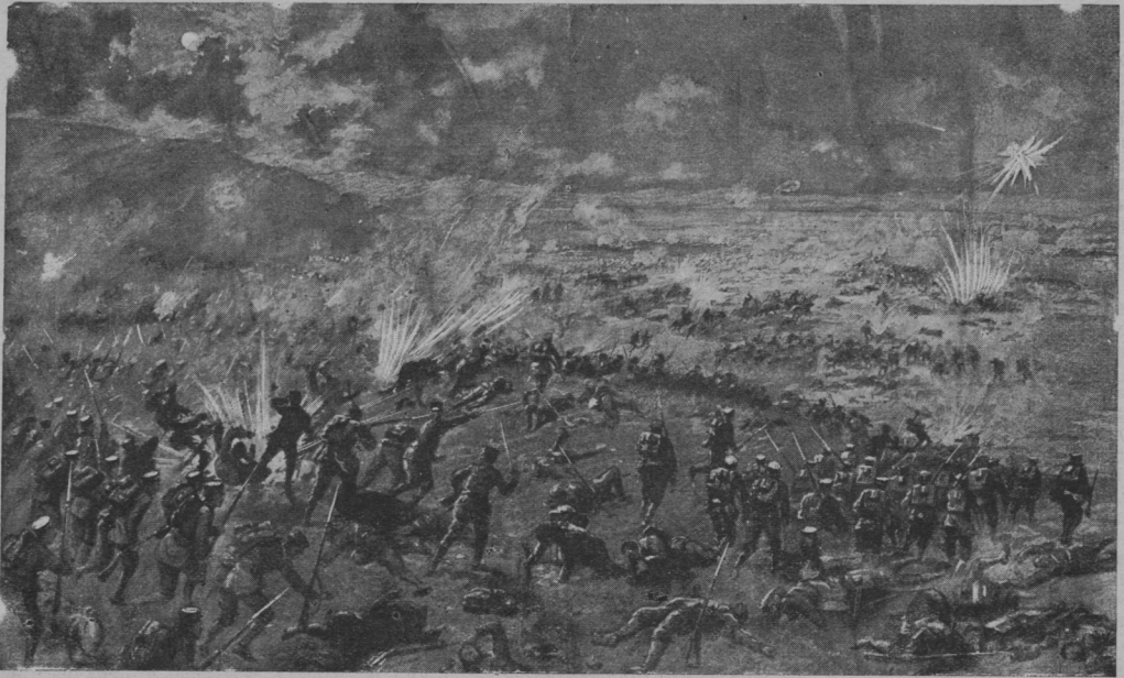
Ночная атака японцев на ляоянскія позиціи. Набросокъ „L'Illustration“.