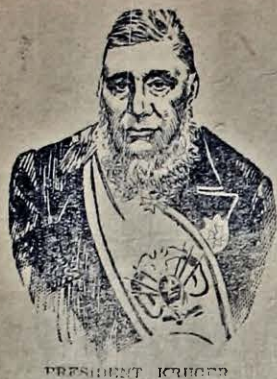
ПРЕЗИДЕНТ КИТАЮ КРИГЕРЪ, президентъ Буровъ въ Трансваали.