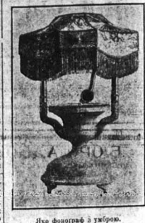
Ілю фотграф з укрІноу.

У ІоуорсЬкЬм мІсЯчнИку "ЕкстрІмІ" РеноварІ (квітень 1919 р.) находИмо оС-таку но-вінну (на сторІні 32-ї):