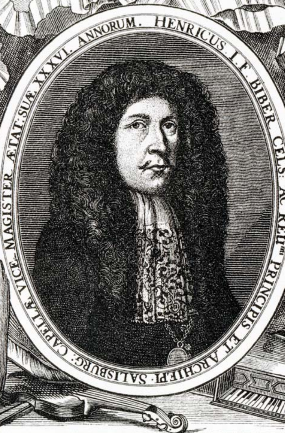
Heinrich Ignaz Franz von Biber