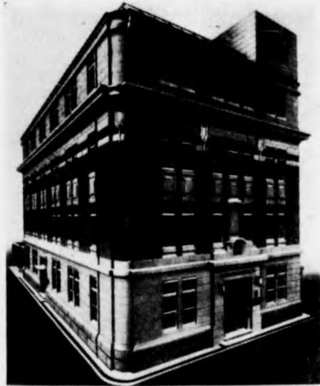
店 本 阪 大