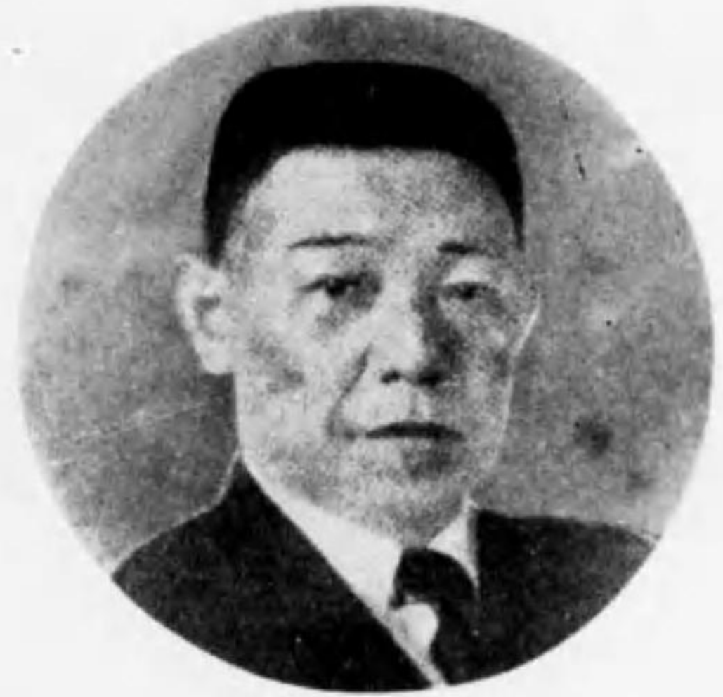
夫 義 田 横 長會役締取