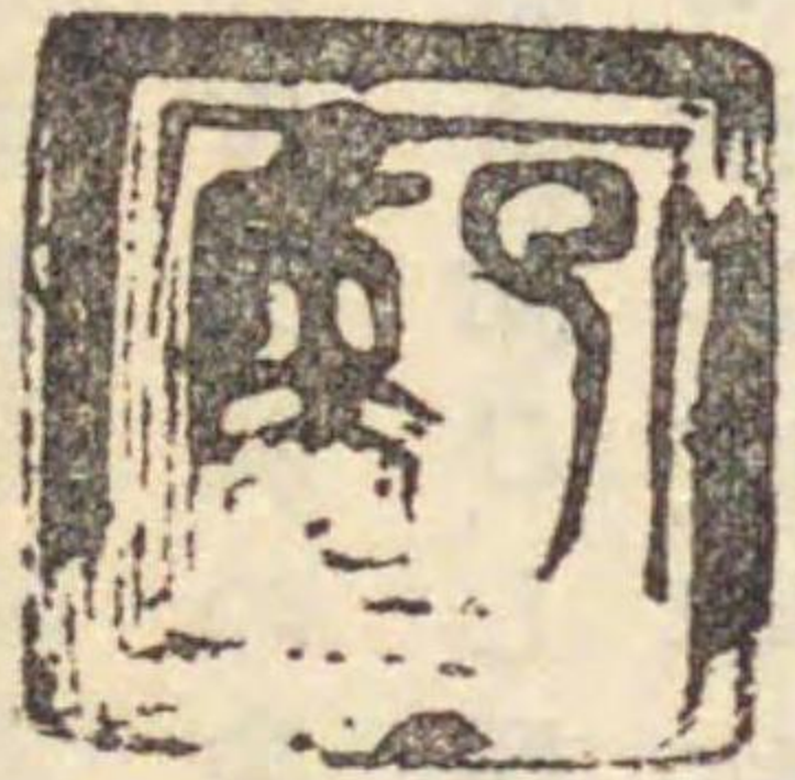
○東京帝室博物館所藏 雪舟筆破墨山水畫贊