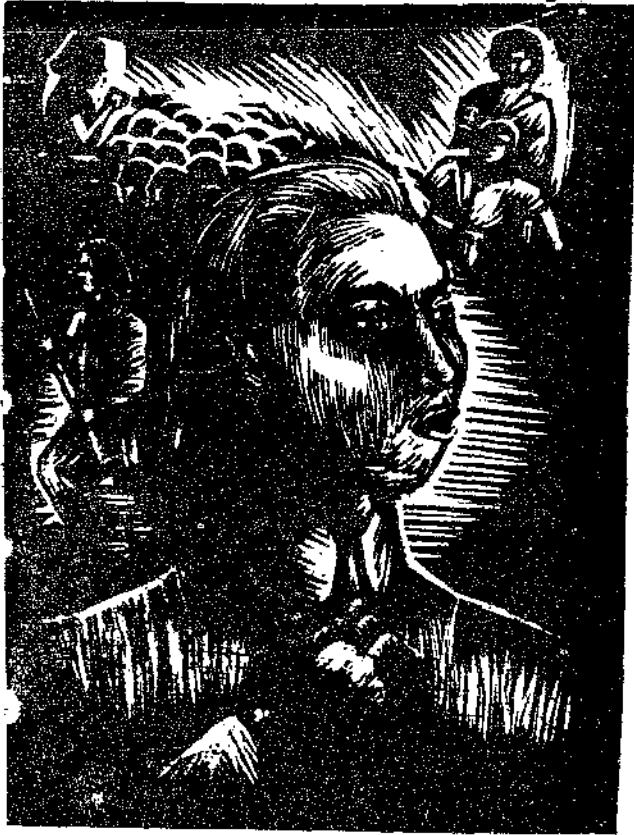
時代女兒一致起來吧！ 納克木刻

在第二階段中值得我特別提出來的是去年暑假前後的反叛運動。一九三八年底以後，上海變爲賣國分子活動的中心，第一砲就是向教育界及學生界進攻，威脅利誘學校當局向偽方登記，用金錢收買個別的腐化份子，企圖使全市三十萬學生受其奴化教育。在叛逆的全面進攻之下，掀起了護校的浪潮，全市