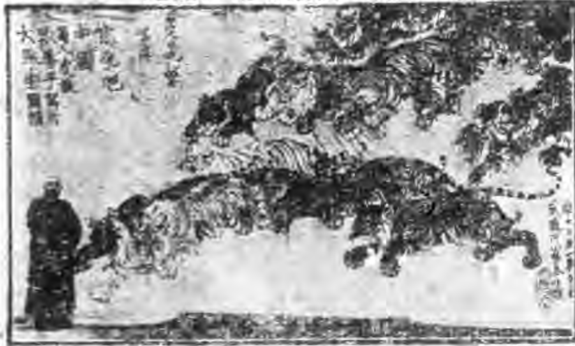
張善子先生抗敵藝術作品之一

是受傷者的鋸割與接骨問題，這個問題，看起來不見得怎樣重要，可是影響於戰士的心理上却非常之大，因為我是傷者之一，是身歷其境的，是身受着痛苦的；在前方浴血抗戰的同志，可說個個人都抱定犧牲的決心，視死如歸，這是事實的可明，但是在未臨戰場以前，常常