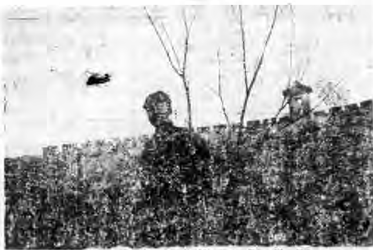
孫伯嬰同伴自寄戰區