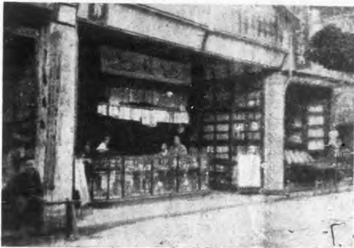
面門所約特館本州湖