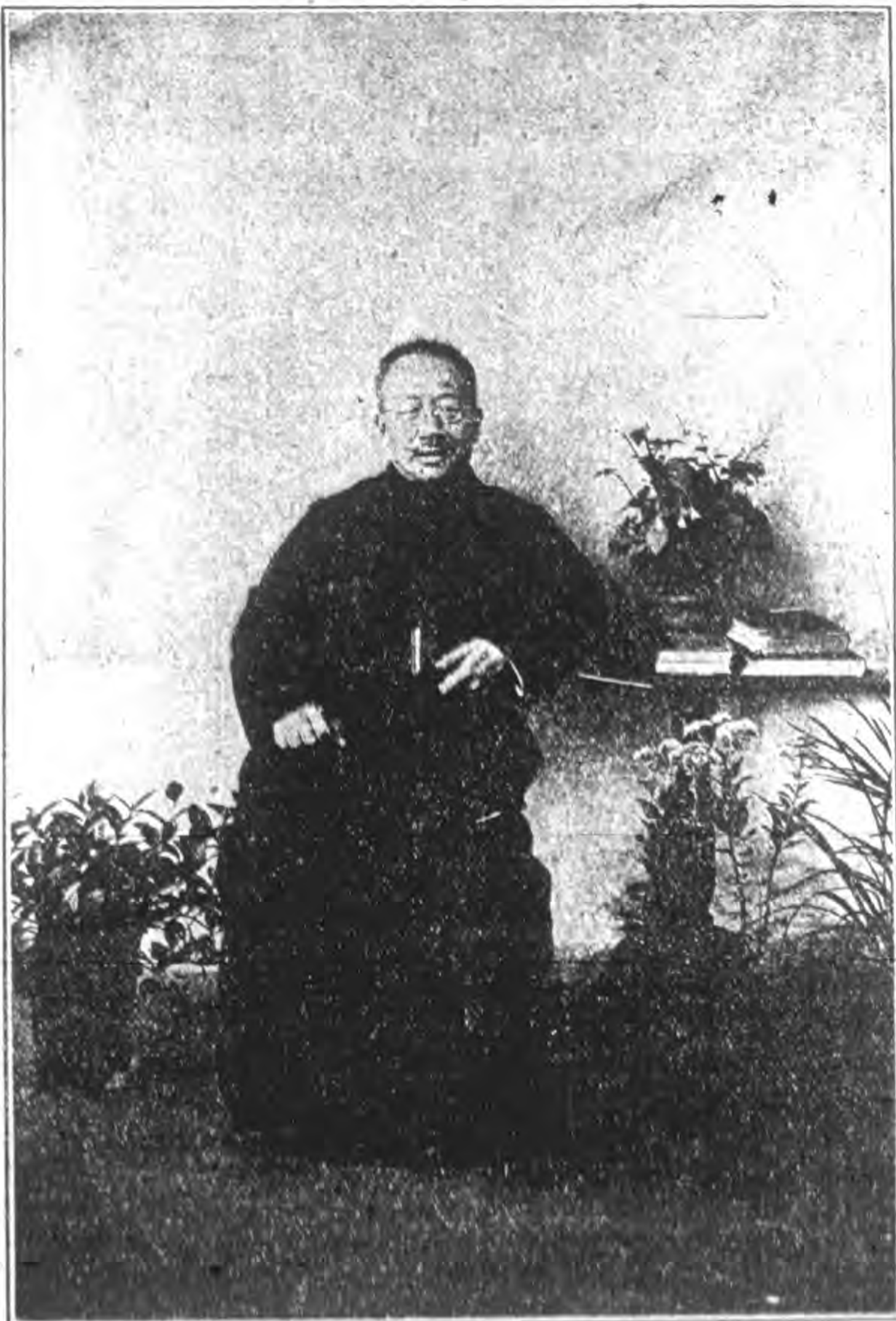
影遺麓秋公潘任主誌雜本