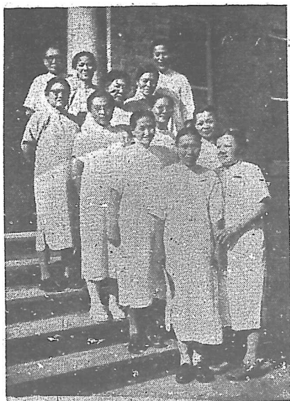
右為校友會全體職員攝影