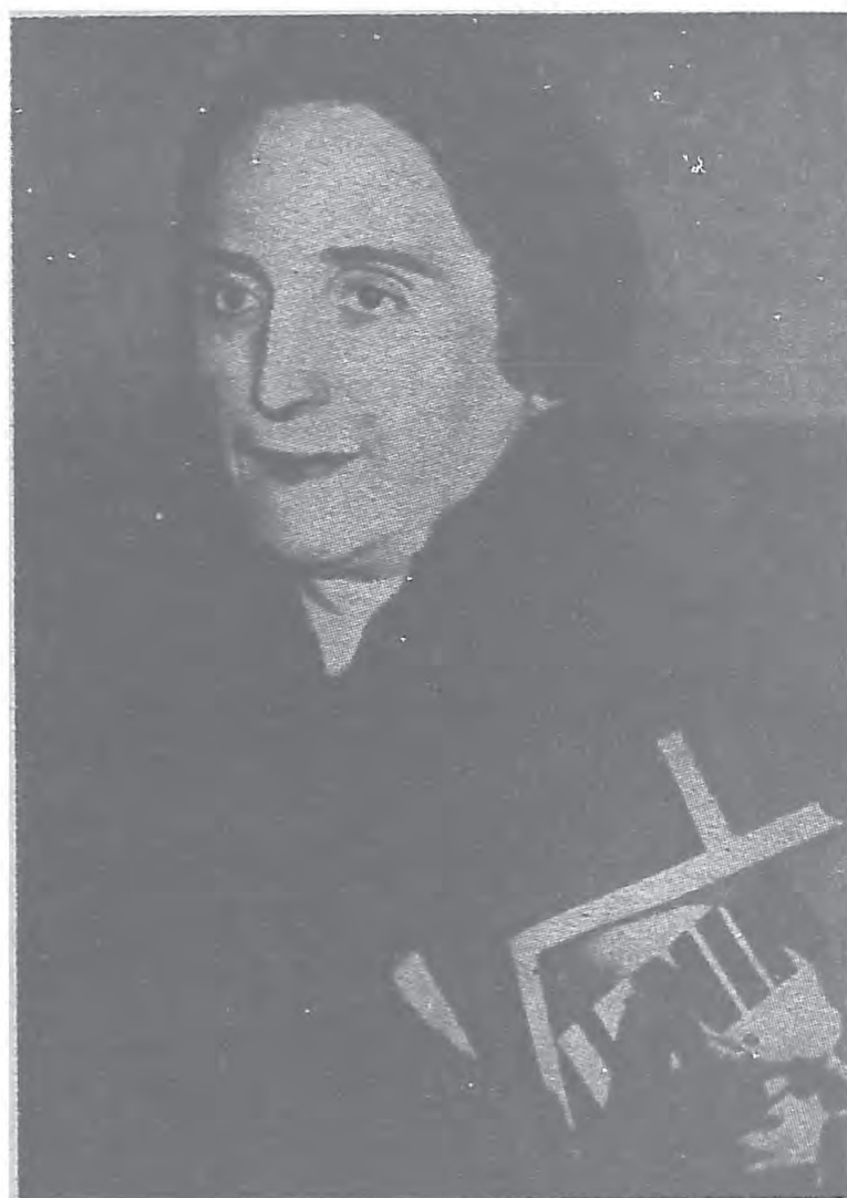
西班牙女莉魯伊袖領命草牙班西