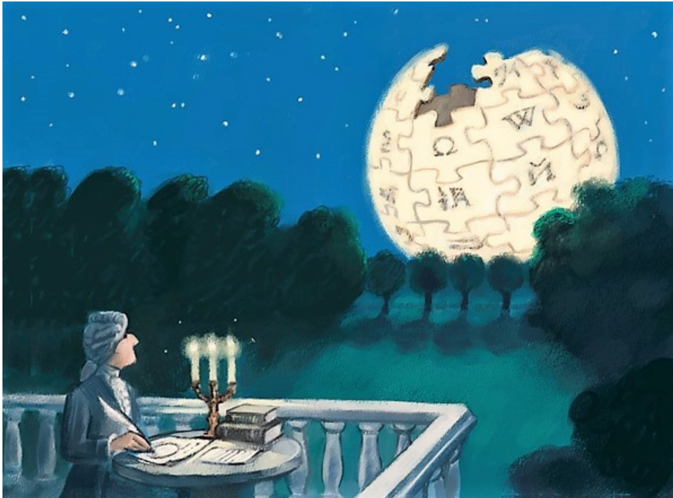
Lauri Voutilainen, Diderot & Wikipedia , 2006.