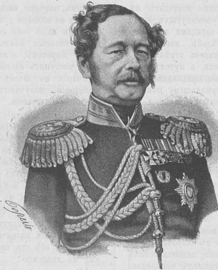
Графъ Н. Н. Муравьевъ-Амурскій