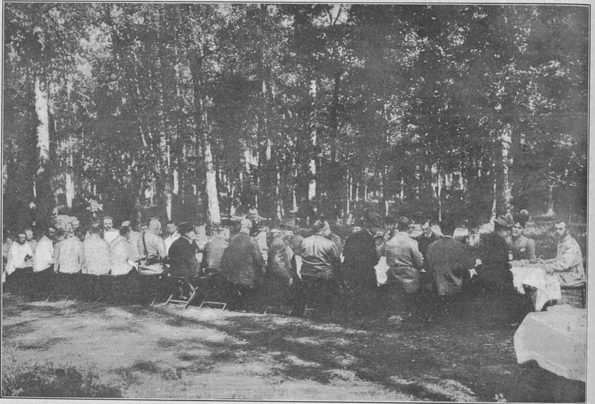
Завтракъ въ Бѣловѣжской пушчѣ (къ статьѣ «Воспоминанія о Бѣловѣжской охотѣ въ 1900 г.»).

Я никогда не могъ думать, чтобы въ пушчѣ была такая масса разнообразнѣйшей дичи; иногда, стоя на флангѣ, можно было видѣть, какъ цѣлыя стада оленей, зубровъ, кабановъ пронеслись черезъ просѣлку, а козъ и нельзя кажется пересчитать; пернатая дичь, напуганная выстрѣлами, теряла способность летать, и нѣсколько разъ наши солдаты ловили