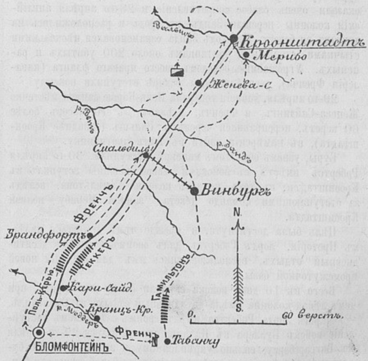
Маршъ Робертса отъ Блѣмфонтейна къ Кроонштадту.

За время своего шестинедѣльнаго пребыванія въ Блѣмфонтейнѣ, лордъ Робертсъ успѣлъ сосредоточить въ этомъ пунктѣ 60-дневный запасъ продовольствія и отремонтировать конницу. Ближайшею цѣлью дѣйствій фельдмаршала былъ Кроонштадтъ — новая столица оранжистовъ, расположенная въ 190 верстахъ къ сѣверу.