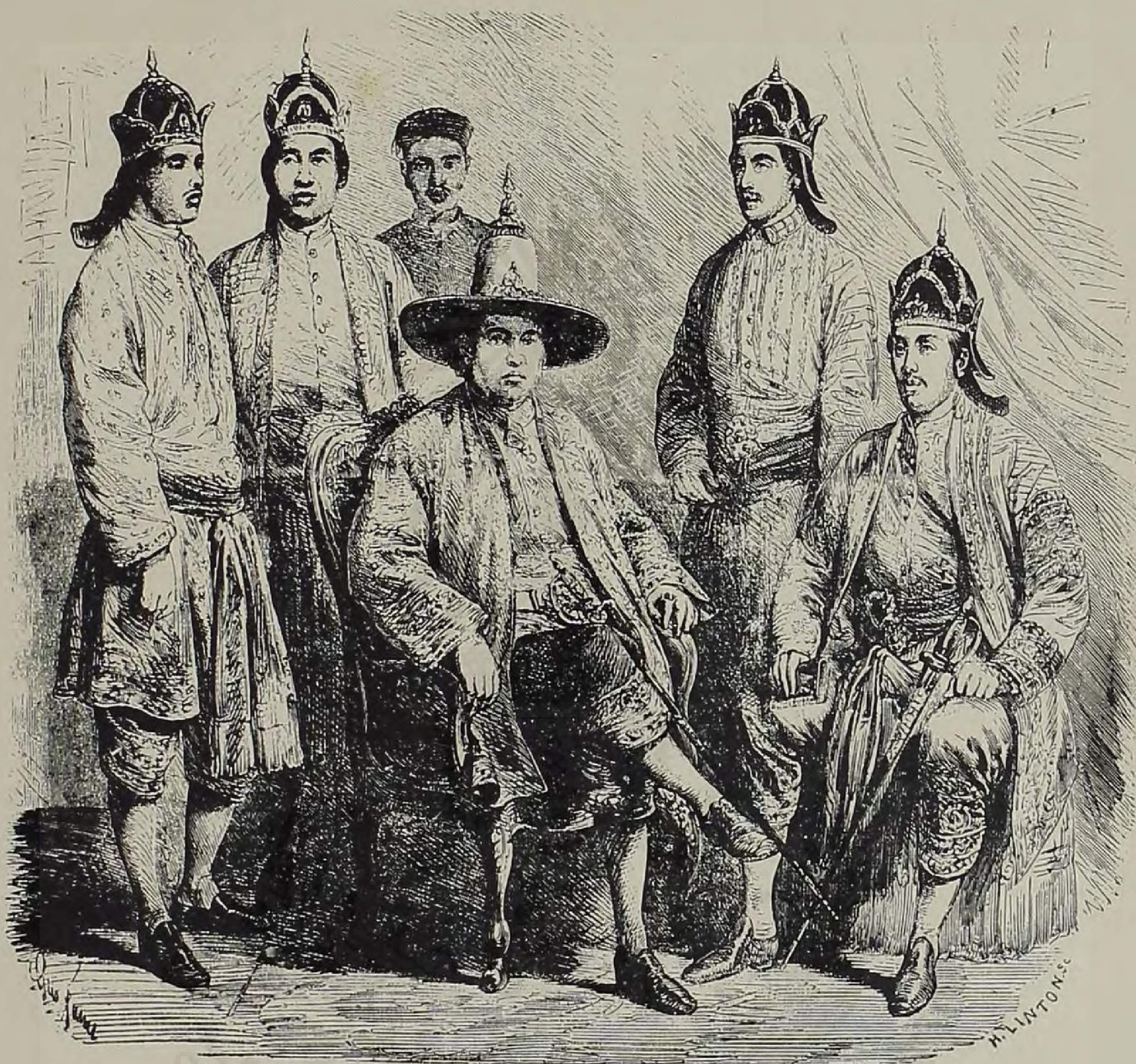
Les ambassadeurs siamois à Paris.

๐ พิศาลงแห่. ขั้แก้วเมียงรัก ลั้ตั้นยงว้พลาค นกปภาคยงว้พลง