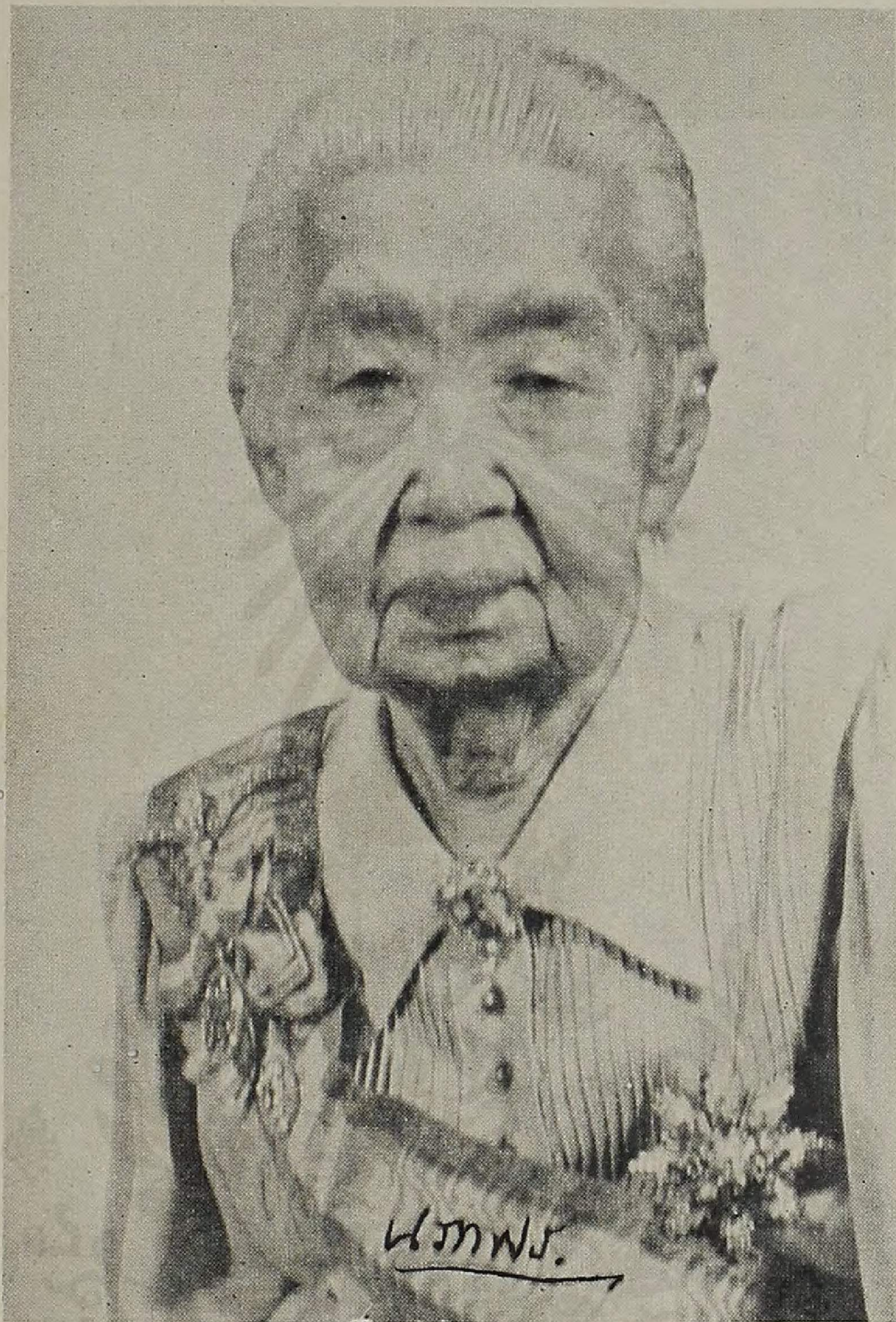
รูป ภรรยาเมื่ออายุ ๘๐ ปี

9 พฤษภ ๒๕๖๓ ๒๕:๑๖ // แต่หัวใจยังไม่แข็งแรง ทำใจได้ สมองก็ยังไม่ดี // ของบใจที่ ทำใจได้ ช่วยเหลือ ในหน้าที่ความ งานที่รับผิดชอบ ๒๕:๑๖ สงวนลิขสิทธิ์ พงษ์กร พันธ์ พงษ์พอมิตถาวร ทุกเมื่อ