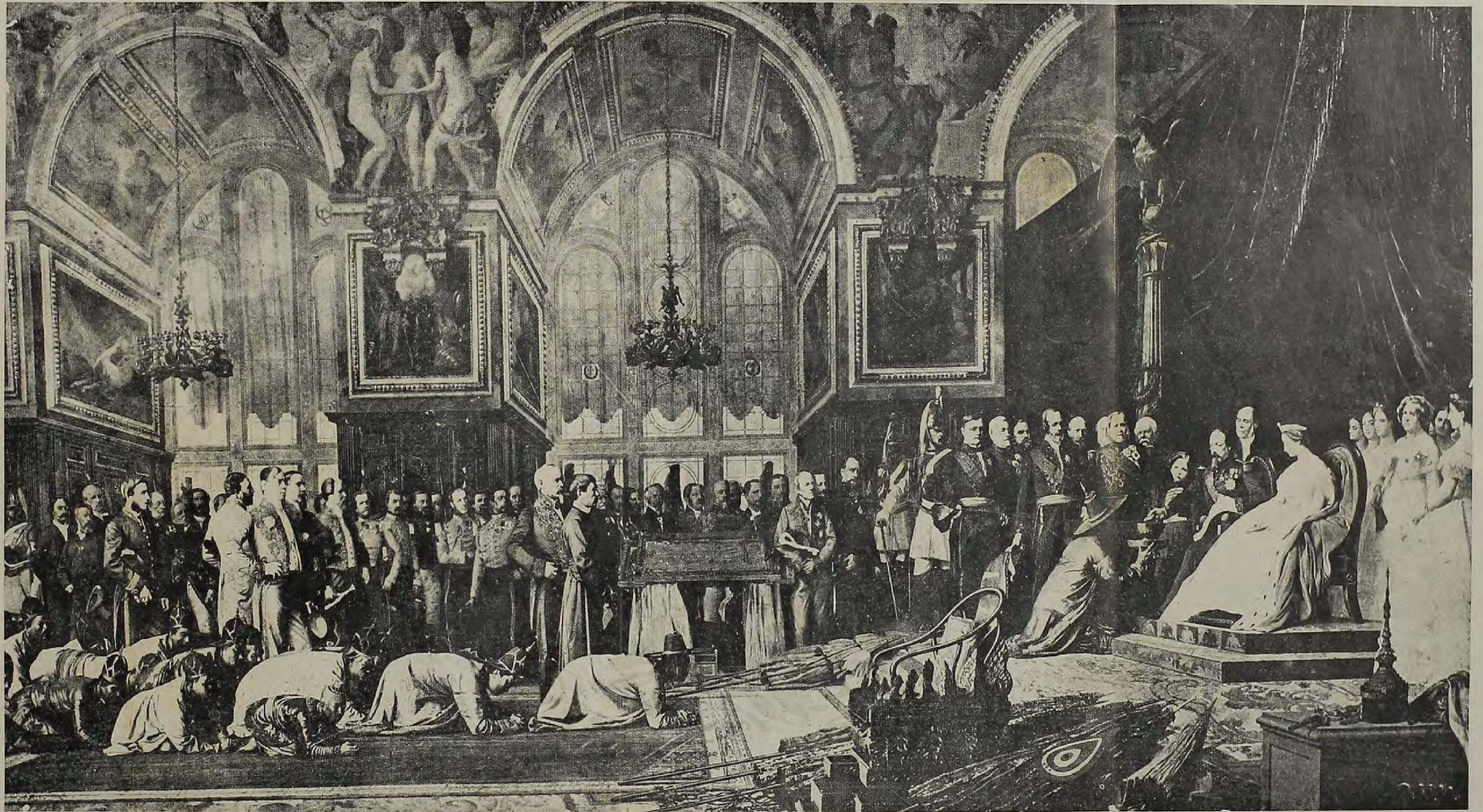
นโปเลียนที่ ๓ เสด็จออกมารับราชทูตไทย เมื่อปีระกา พระพุทธศักราช ๒๔๐๔.