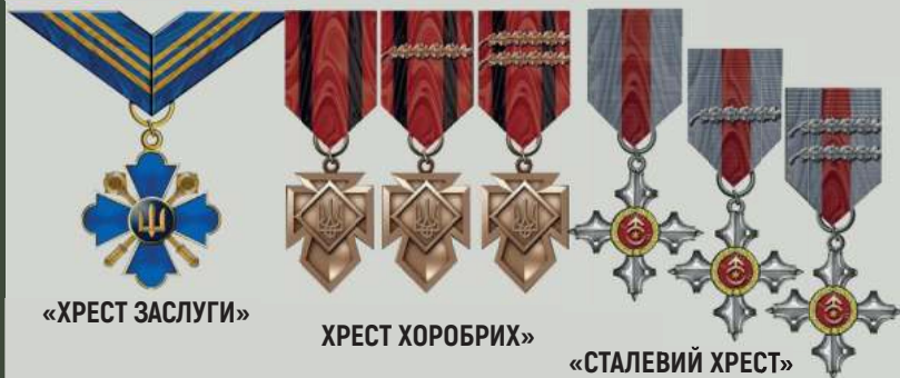
Як зазначається у положенні про почесні нагрудні знаки Головнокомандувача ЗСУ, ці відзнаки можуть бути у вигляді хрестів і медалей.

Відповідно до Указу Президента України від 27 березня 2020 року № 123/2020 «Питання Головнокомандувача Збройних Сил України» встановлено такі ПОЧЕСНІ НАГРУДНІ ЗНАКИ :