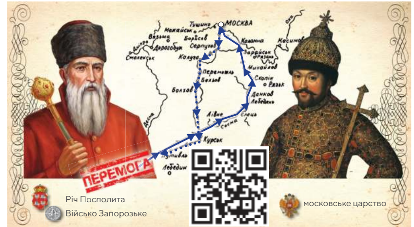
Річ Посполита Військо Запорозьке