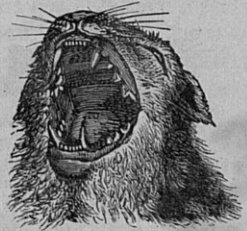
Fig. 34. — Gueule de chat. En avant, 4 dents longues et pointues ; en arrière, dents tranchantes.

que lorsque l'animal allonge les doigts pour grimper ou pour frapper sa proie *. Regardons la gueule maintenant (fig. 34), mais faisons vite : voyez, de chaque côté, ces longues dents fortes et pointues qui prennent la proie *, et derrière, ces autres dents qui sont tranchantes, jouent l'une sur l'autre comme des ciseaux, et déchireront la