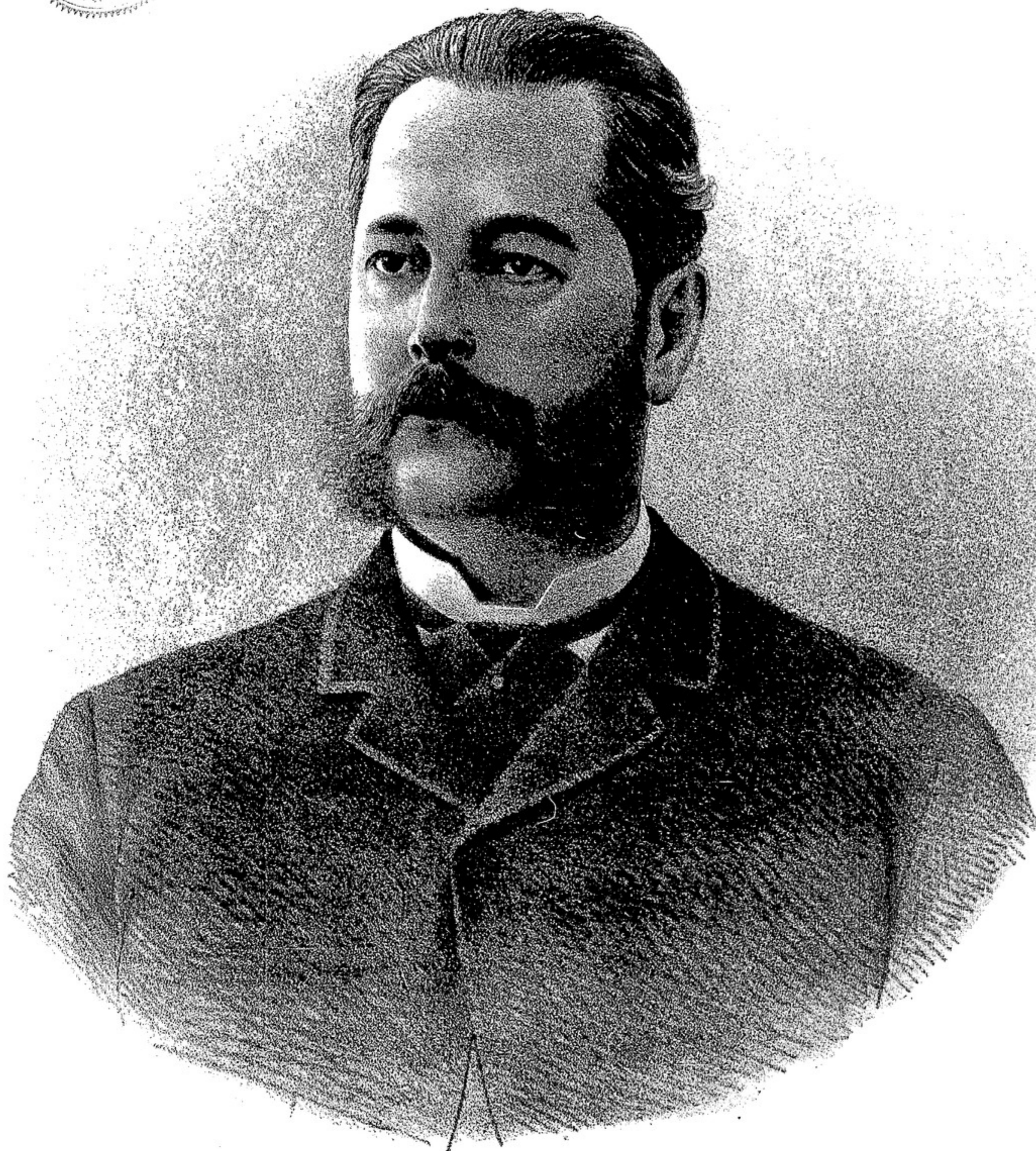
DOCTOR DON SALUSTIANO J. ZAVALÍA INTERVENTOR NACIONAL EN LA PROVINCIA DE TUCUMAN