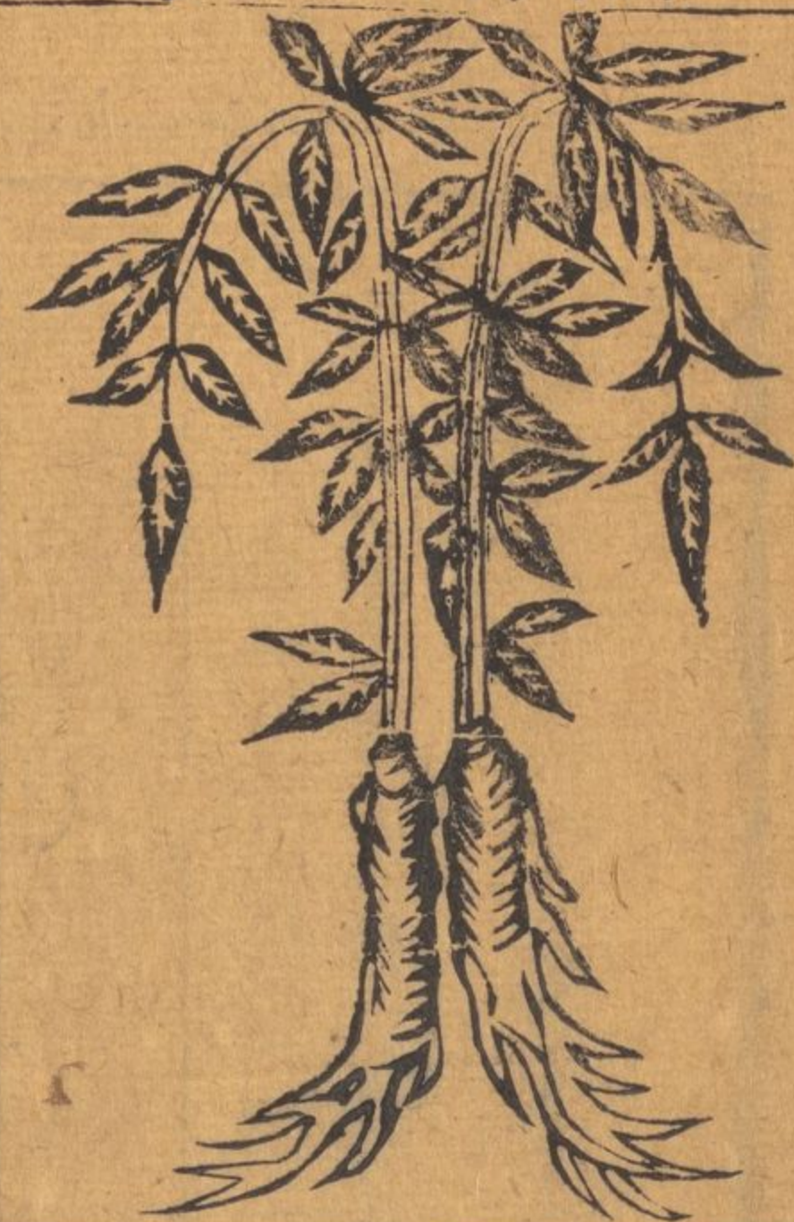
滄州沙參 滄州沙參