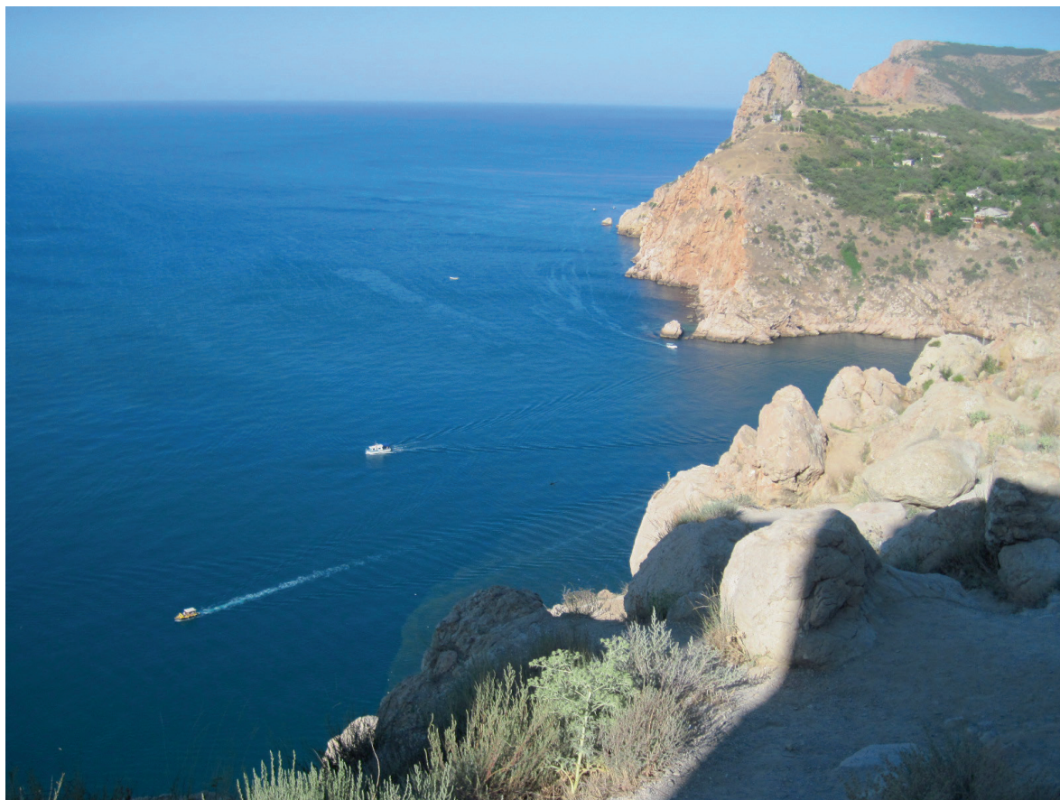
Вхід до Балаклавської бухти (Симболон Лімен), 2012 р.

мабуть, усім відому книжечку «Легенди Криму». Там була оповідь і про дівчину на ім'я Іфігенія, доньку грецького царя і наречену героя Ахілла, яку греки принесли в жертву богу Посейдону під час плавання до Іліону, відомого ще як Троя. Ті події, оспівані аедом, співцем давньої історії Еллади – Гомером у гімнах «Ліади», відбулися близько 1200 р. до н.е. і відомі нам як Троянська війна. За легендою богиня Артеміда викрала дівчину з-під жертвового ножа, поставивши замість неї білу лань. Іфігенію ж богиня перенесла до свого святилища у Тавриді – землі таврів, де вона решту життя приносила в жертву усіх греків, що потрапляли в ці землі. Ахілл довго шукав свою наречену, але так і не знайшов, отримавши від богів у володіння острів Левке і безсмертя. Згодом брати Іфігенії Орест і Пілад викрали її у таврів разом із ідолом Артеміді і привезли до Авліди,