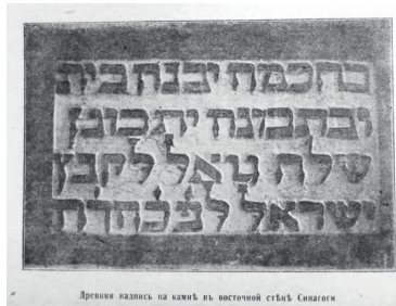
Напис 1460 р.: «Зі знанням побудуй будинок і з розумом підготуй; пішли Спасителя збирати вигнанців Ізраїлю»

ніби застиг час. Збереглося чимало стародавніх невисоких білих будинків, накритих черепицею-сарматкою, що виходять на вузькі вулички слободи. Центральна вулиця цієї місцини, звичайно ж, називається Караїмською. Важко передати її характер і колорит краще й поетичніше, ніж це колись зробив Іван Михайлович Саркісов-Серазіні – лікар і науковець, який залишив нащадкам спогади про Феодосію: