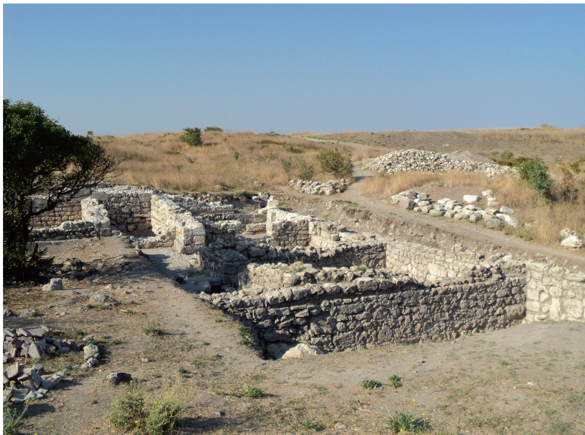
Херсонес Таврійський. Розкопки кварталу римського — середньовічного часу, 2011 р.

чено цілі цикли міфів, патронатка одного з найбільших полісів Північного Причорномор'я повинна була мати грандіозну храмову центральну споруду і чимало невеликих храмів. Геродот і пізніші автори згадують храм Діви у Тавриці, але чіткої локалізації його ніхто не наводить. Ймовірно, що жоден з авторів не бував у Тавриці, а записи лишилися із оповідок моряків і негоціантів. Чи бачили храм мандрівники, також є питанням, на яке немає відповіді.