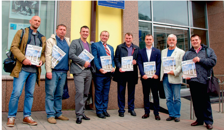
Після презентації спеціального номера журналу «Пам'ятки України: національна спадщина» на тему: «Пам'ятки Криму – сучасний стан культурної спадщини України».

Важливо, що Протоколом встановлено можливість екстрадиції осіб, які підозрюються у знищенні або присвоєнні у великих масштабах культурної власності, якщо надійде запит від правоохоронних органів. Це значно сприятиме притягненню до відповідальності осіб, які по-