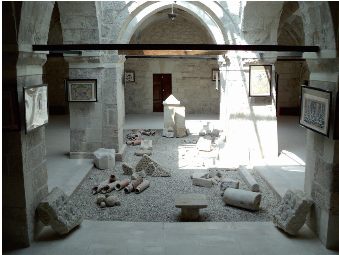
Зинджирли-медресе, Салачик, Бахчисарай. 2005 р.

Ця специфіка атавізмів у кримській історії та демографії і визначає інтерес до нього археологів, а 250 років досліджень показують дуже високий рівень розробки наукової проблематики. Ще одним дуже важливим чинником, що визначає інтерес археологів до кримської землі, є її геотектоніка. Річ у тім, що рівень Чорного моря сильно коливався від плейстоцену до голоцену. Трансгресії і регресії зафіксовано для нього і протягом голоцену. Скеля, на якій лежить Крим, представлена залишками мегантиклінорія на півдні, який формує Головне пасмо Кримських гір, антикліналями і синкліналями передгірних і прибережних районів. Висока топографія археологічних пам'яток Криму вберегла їх від затоплення або розмиття