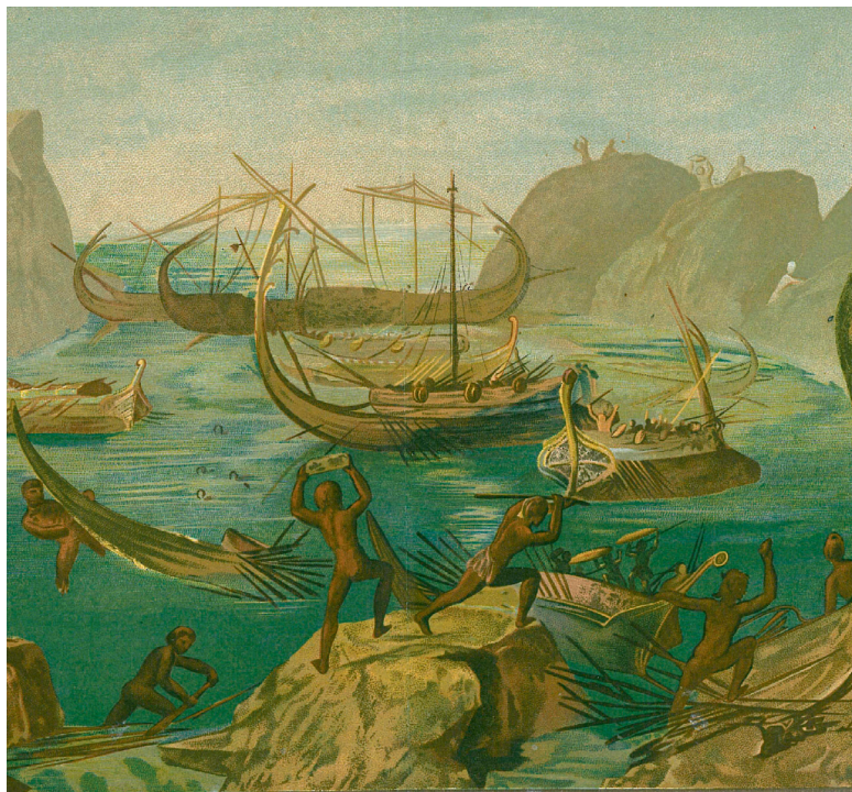
Лестригони атакують Одиссея

під час припливів. Цим Крим якісно відрізняється від прибережної лінії материкової частини Північного Причорномор'я. Археологічні пам'ятки у Криму містять залишки життєдіяльності, як кажуть in situ, тобто на момент припинення життєдіяльності. Цьому також сприяють бідні ґрунти Криму із мінімумом земляних тварин, що перемішують нашарування. Це, а також дзеркальне відображення усіх подій, що відбувалися на материковій частині Причорномор'я, створили у Криму унікальні стратиграфічні колонки, що дозволяють археологам встановити послідовність подій без даних писемних джерел. Наповнення речами археологічних пам'яток Криму в разі перевищує пам'ятки материкової України.