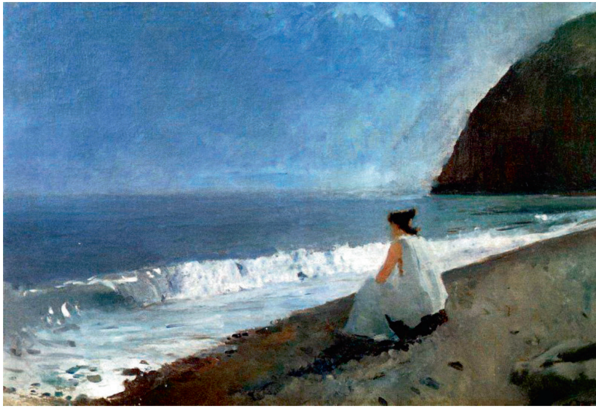
Картина В. Серова «Іфігенія в Тавриді», 1891 р.

Але ж ми, за даними археологічних розкопок, зараз знаємо, що Партенос була верховною богинею не таврів, а Херсонеса Таврійського. Красуня Партенос зображена на херсонеських монетах, згадана як рятівниця і заступниця у херсонеських декретах, її ім'ям клялися у вірності державі херсонесити. Отже, таке високе божество, якому присвя-