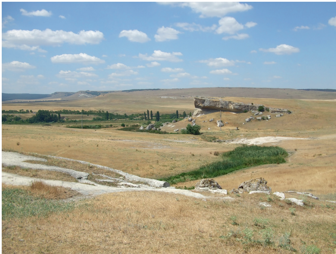
Виступ плато з Ак-Кайським пізньоскіфським городищем. Білогірський район, с. Вишенне, 2007 р.

when he was first appointed to the government of the Taurida. Reuilly was supposed to have been sent thither by Buonaparte, to sound the feelings of the Tatars, and ascertain the political state of the Crimea. His brief detail of the ancient history of this country is a recapitulation of the above-mentioned writer; and in his continuation of its history, he had an able coadjutor and friend in Professor Pallas: nevertheless, there are subjects where the hasty judgment of a Frenchman is marked, or where the interval of time since he wrote, has produced change.