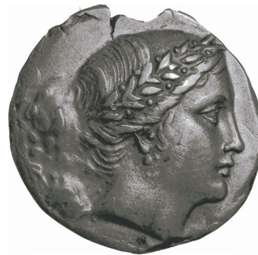
Партенос. Монета Херсонеса, драхма, срібло, III ст. до н.е. НЗ «Херсонес Таврійський»

На тлі такого масового вивезення раритетів із Криму до Санкт-Петербурга і Москви особливо гостро сприймається питання виставки кримського золота в Амстердамі, повернення якої до Києва зараз у судовому порядку відстоює Україна. Тільки за 25 років незалежності з Криму перестали вивозити рарите-