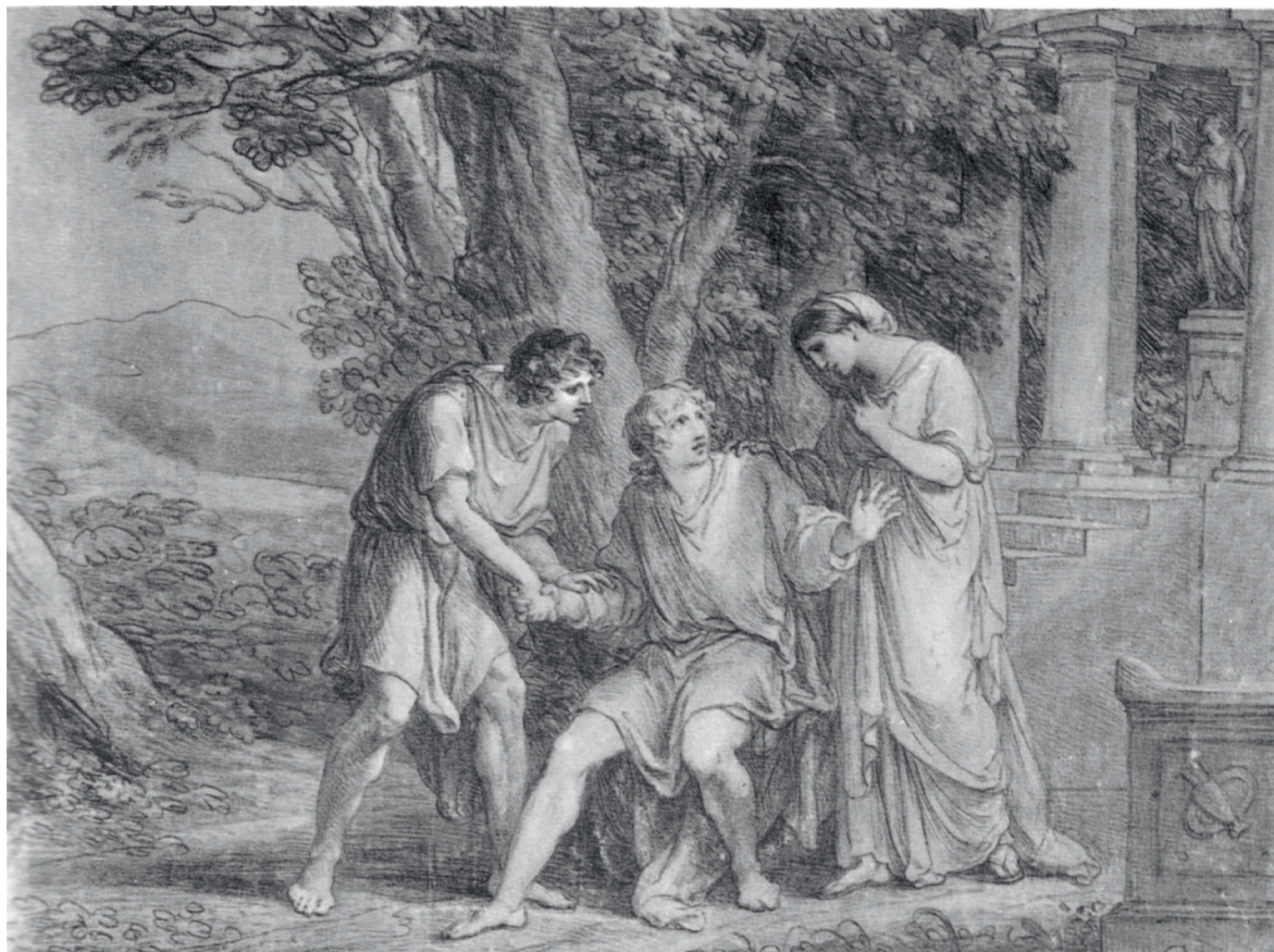
Ангеліка Кауфман, «Іфігенія в Тавриді», 1803 р.