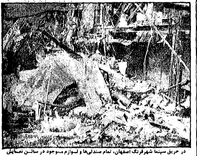
در حریق سینما شهر فرنگ اصفهان، تمام صندلیها و لوازم موجود در سالن نجات یافت سوخت و به خاکستر تبدیل شد. عکس، سالن سینما را پس از اطفای حریق نشان میدهد.