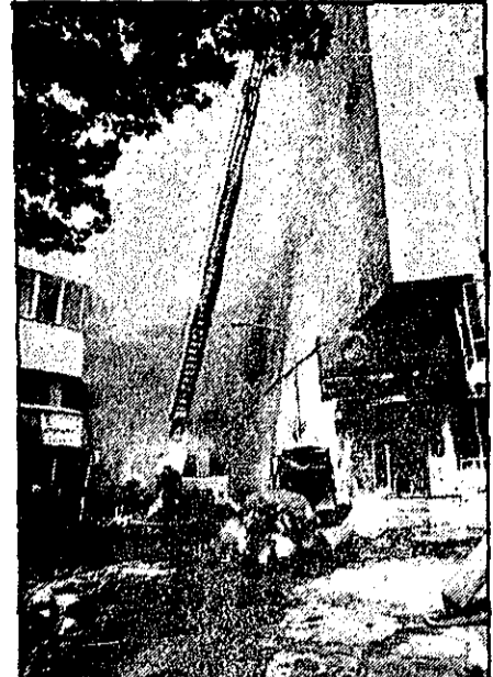
شعله‌های آتش از زیر زمین گاباره با کار ۳۳ ساعت ساختمان سینما آتلانتیک زبانه می‌کشد و مأموران سعی می‌کنند با استفاده از پله بلند خود را به شعله‌ها برسانند و آتزا خاموش کنند.

در یک آتش‌سوزی ۱۳۷۵ ساعته که در گاباره با کار ۳۳ ساعت سینما آتلانتیک تهران روی داد، مأموران آتش‌سوزی با استفاده از پله بلند خود را به شعله‌ها برسانند و آتزا خاموش کنند.