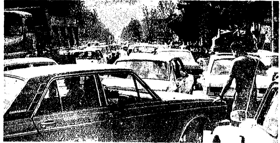
صدها هزار وسیله نقلیه چنان گرد کوری در تهرانیک شهر هی شمالی ایجاد کردند که در کورن سن حداقل ۳ روز وقت گرفت. عکس گوشاهی از ترافیک رست با در ۳ روز اخیر نشان میدهد. ۷۰ هزار اتومبیل هم رست راه هفتاد و چار کردند وهم مسافران دریا را.

در متلوقه یک گرانفروش ۱۵ بار در یک روز جریمه شد!