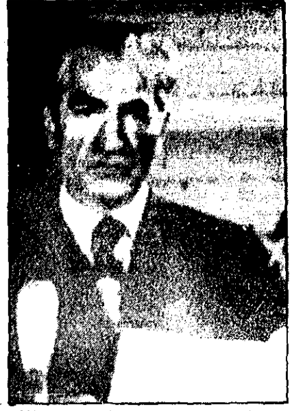
شاهنشاه در پیام سالروز مشروطیت فرمودند: در انتخابات آزاد، تعداد طرفداران تمدن بزرگ و دیسگران روشن میشود.