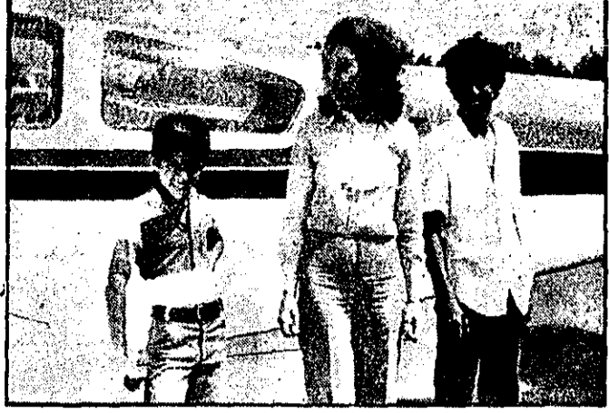
الا گهر رامین خاتمی (سمت چپ) دیروز پس از اولین پرواز هواپیمای باغی والا گهر کامبیز خاتمی با مادرشان والا حضرت شاهدخت فاطمه پهلوی عکسی در کنار هواپیمای بسیار کاری گرفتند.

رود در این راه ماهر شدند و من نیز چون خلیبان هستم، در راه رسیدن باین هدف بانها کمک کردم. والا حضرت اضافه کردند: من امیدوارم نوجوانان و جوانان بیش از این نسبت به فراگیری فن خلیبانی که مسورد احتیاج کشور است، علاقه نشان دهند. والا گهر رامین خاتمی پس از پرواز کنار هواپیمای فرار گرفتند و والا حضرت شاهدخت فاطمه طوق سنت معمول سطل آسی روی سر والا گهر ریختند که یکی از فلسفه های آن نکستن غرور خلیبان هنگام پرواز است در این مراسم سپید امیر حسین رسمی فرمانده نیروی هوایی شاهنشاهی و رئیس شورای عالی پادشاه هواپیمایی شاهنشاهی، معاون عملیاتی پادشاه و معلم خلیبان والا گهر رامین خاتمی شرکت داشتند.