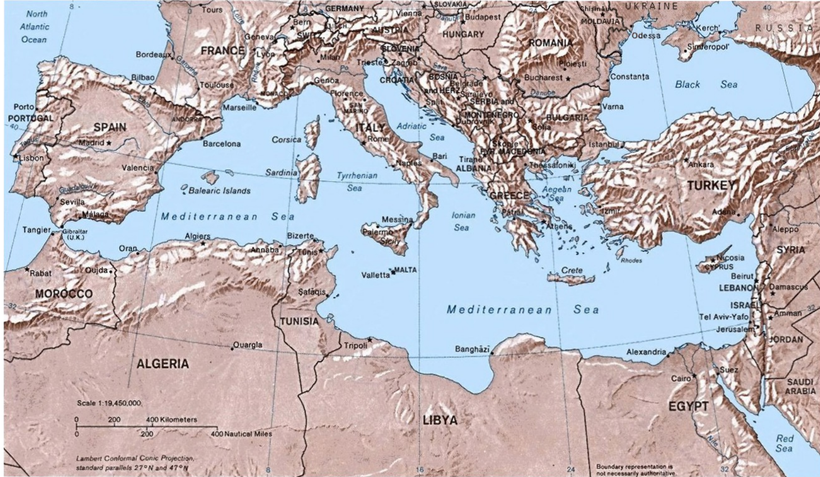
Spain, France, Italy, Malte, Slovenia, Croatia, Montenegro, Albanie, Greece, Turquie, Chypre, Syrie, Liban, Israël, Palestine, Maroc, Algérie, Tunisie, Libye, Égypte