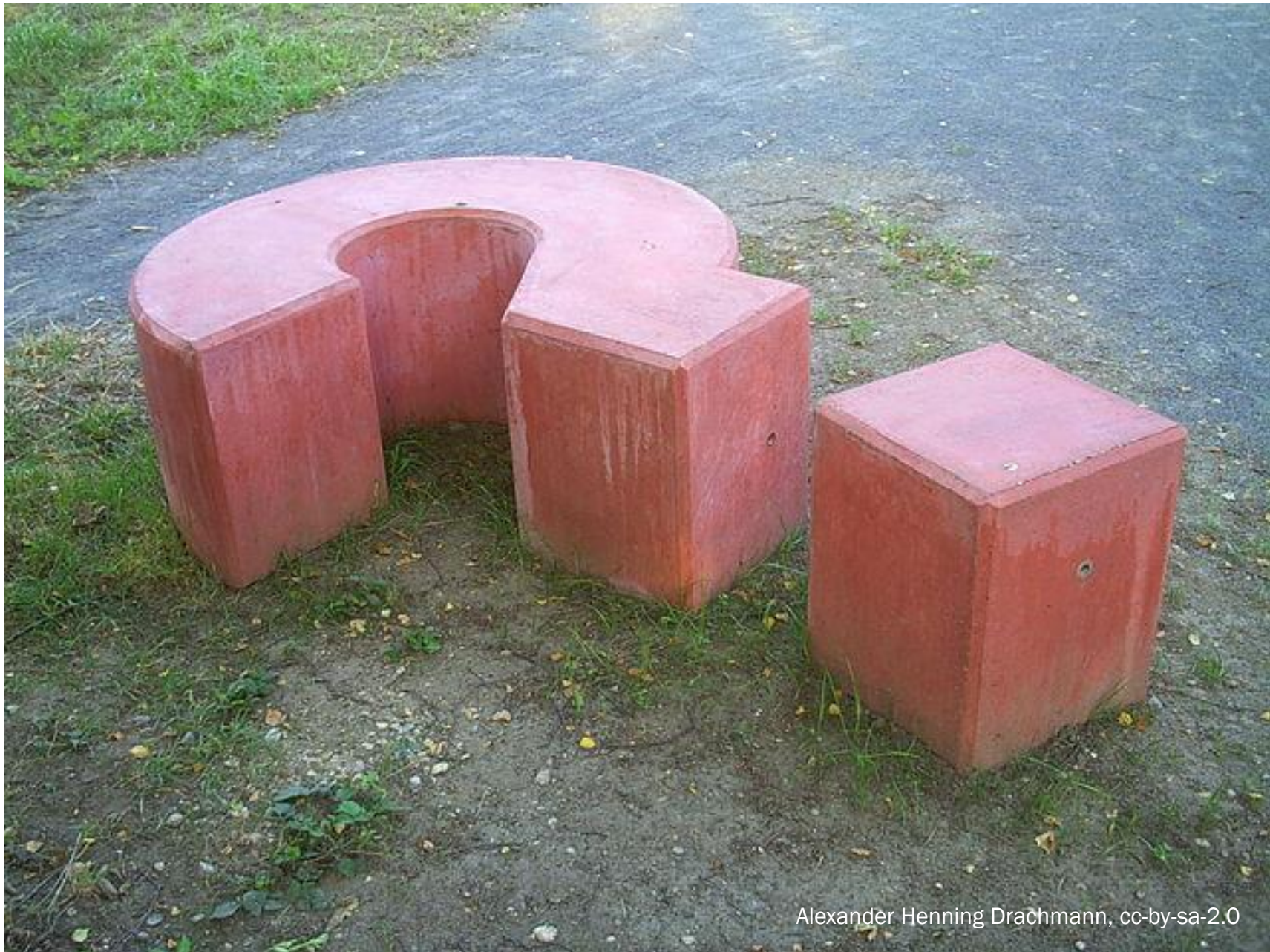
Alexander Henning Drachmann