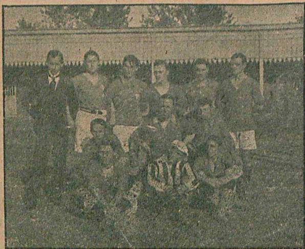
Харьковская футбольная команда Саде Атлетикъ-Клуба, выигравшая матчъ у сборной Ростова на-Д. 25 сент.

«Викторія» начинаетъ пускаться въ ходъ грубые приемы, что обычно въ игрѣ этой команды,