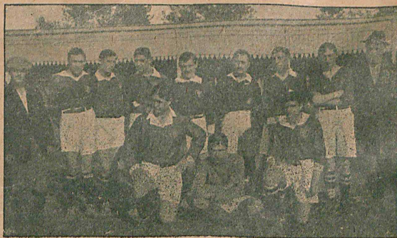
Сборная футбольная команда Ростова на-Д., игравшая въ Ростовѣ на-Д. 25 сентября съ Харьковской командой С. А. И.