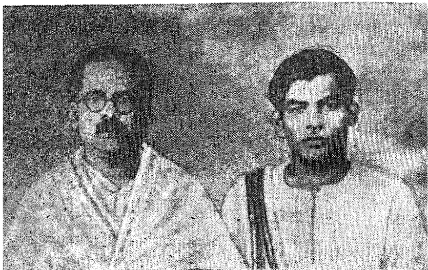
பாவேந்தரும் முல்லை முத்தையாவும் (1946)