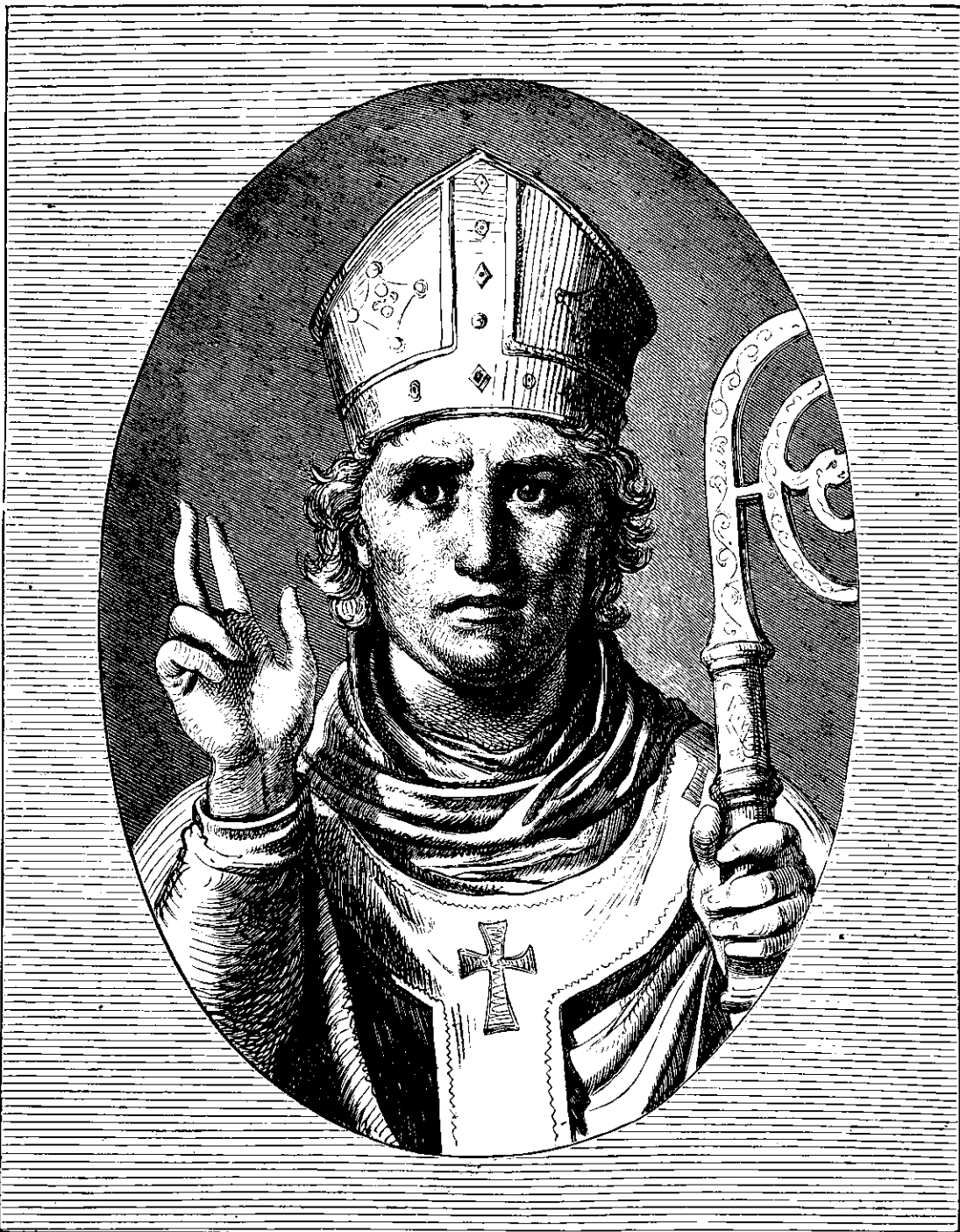
Erkebisp Absalon. (Kultegning af Professor Constantin Hansen.)

Denne forunderlige Klippe hæver sig overalt næsten lodret i Veiret, og Forbindelsen med Spanien mod Nord er saa lav, at den allerede i meget ringe Afstand viser sig som en Ø; kun den vestlige Side falder nogenlunde jævnt af, og kun her har Naturen tilladt at anlægge en By. Klippen er mod Vest begrænset af den store rummelige Bugt, som Middelhavet sender ind, og ved hvis vestlige Bred Algeziras ligger. Gibraltar hed i Oldtiden Calpe, og dette Forbjerg, i Forening med det paa Afrikas Kyst ligeoverfor liggende Abula, kaldtes under eet Herculesstøtterne. Først i Aaret 710 begyndte dette vigtige Punkt egentlig at spille en Rolle i Historien, som vi ganske fortelig skulle omtale. Det var Vestgothernes sidste Konge Roderik, som ved sin stændige Dyrkelse imod en anseet Adelsmands, Statholderen i Ceuta's Datter, gav Anledning til, at Faberen sammensvør sig med flere Mægtige imod ham og søgte Hjælp i Afrika. Den arabiske Feltherre Tarif, efter hvem Klippen senere fik Navn, gjorde da med 500 Mand Indfald i Landet og vendte tilbage saa rigt belæstet med Bytte, at det ikke varede længe end til det følgende Aar, da en Armee paa 12000 Mand, atter under Tarif's Anførsel, landede i Bugten. Det kom efter flere smaa Stærmplyer til et afgørende Slag ved Xeres de la Frontera, hvorved det vestgothiske Rige og dermed Gibraltar kom i Arabernes Besiddelse. Først i 1309 blev det erobret af Kong Ferdinand af Castilien og forblev nu i Spaniernes Besiddelse