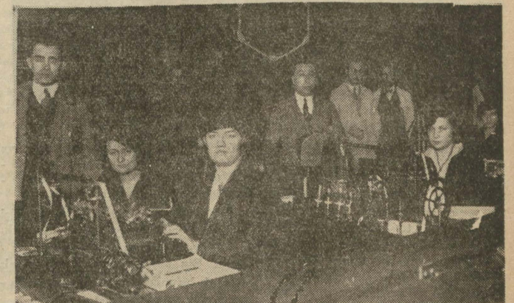
İstanbul telsizinin daktilo dairesinde hanmlar çalışırken

İstanbul telsizi gemiler ve bütün Avrupa merkezlerle görüşmektedir