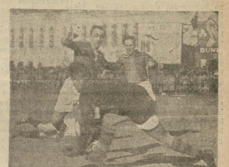
Avni sakatlanmasla neticelenen fedakârane kurtarışı yaparken

Takımlar sahaya çıkmadan evvel, seviricilerin yegâne düşüncesi, iki tarafın birinin galibiyet ve mağlûbiyetin-