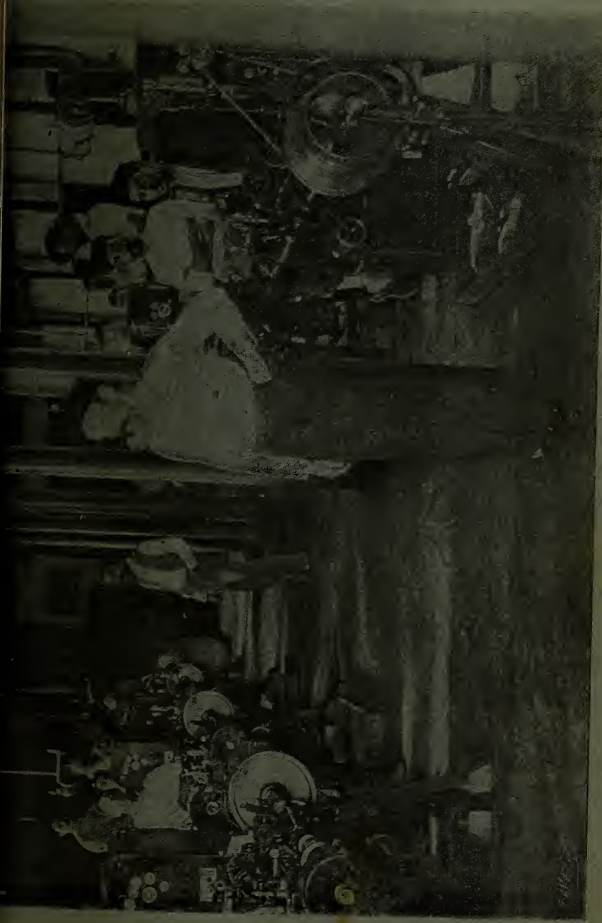
Magníficas máquinas BARON que elaboran diariamente UN MILLON de los inmejorables SUSINI, cigarrillos ELEGANTES, BOUQUETS de "La Legitimidad" y las solicitadas PANETELAS.