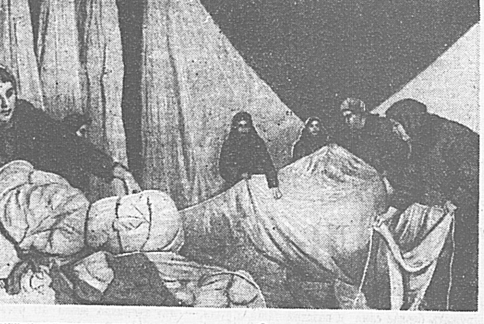
Девушки-колхозницы укладывают парашюты. Они помогают десантникам сохранить ценное военное имущество.

ТОКИО, 16 мая. (ТАСС). По официальным сведениям, 10 мая японские войска, продвигаясь на территорию Китая на 80 миль от границы Бирмы, заняли в провинции Юньнань горы Дочун.