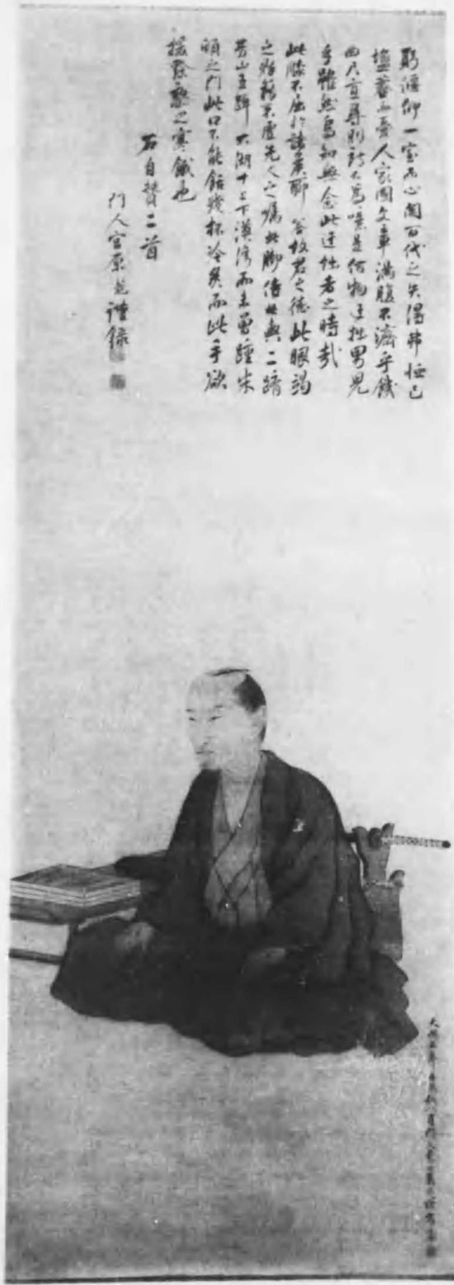
安藝 相原格氏所藏