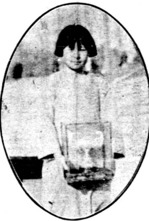
← 士女榮桂王之盃協體獲奪 →

本市女子網球之概況，已略如上述，惟長此以往，將永無進展之希望。蓋有業餘資格，而已離學校之婦女，多爲職業及家庭所累，除在辦公時間外，即回家操作，實不暇及此，其無職業，及不須操作之小姐太太，又每以多愁多病，弱不勝衣，方合美人之方式，除塗脂抹粉而外，反以通空氣，見日光，能使皮膚粗糙，面色黧黑，防害其東方典型之美，又何論跑來奔去之網球運動乎。至於本市中等以上之女子學校，其球場之設備，除山大略具規模，而便於女子運動之外，他如女中文德等之網球場，不敷支配之數，相差遠甚，且網球場之設備，就表面言之，似覺簡單，而各種費用則甚昂貴，在學生時代，而提倡網球運動，似非所宜，所望於市政當局，及負有提倡運動之責者——青島市網球會，及體育協進會，在市內入煙幅棧之處，廣闢網球場，多倡導婦女運動，蓋婦女爲國民之母，婦女之強弱，其影響於整個之中華民族者實大，且網球運動，爲至高尚之娛樂，其有關於一國之文化，西哲已言之屢矣，近世以來，主持「白維斯盃」之諸君子，每倡言於世界曰：「欲占一國文化之高低，可視其國內網球場之普遍與否而定」旨哉斯言，吾人可不警惕乎？