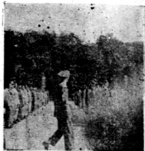
→ 團長進入點開場代表肅立致敬