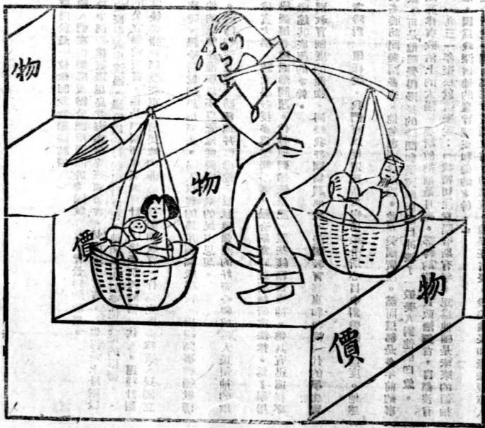
文人的 一枝筆担不起 一家的生活