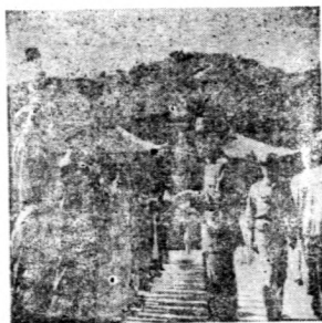
← 團長點名時代代表舉手作答

我們深信有所不為，而後可以有為。我們不願做官，我們願做政客。我們必須努力各種建設工作，願把我們的心力，貢獻到社會服務，貢獻到生產事業。我們認為改造社會，為改造政治的前題，建設社會，為建設國家的根本，大家如果放棄社會上各種事業不管，那末，澄清政治，建設國家，也就永遠沒有希望了。 ——節錄青年團二 全大會宣言——