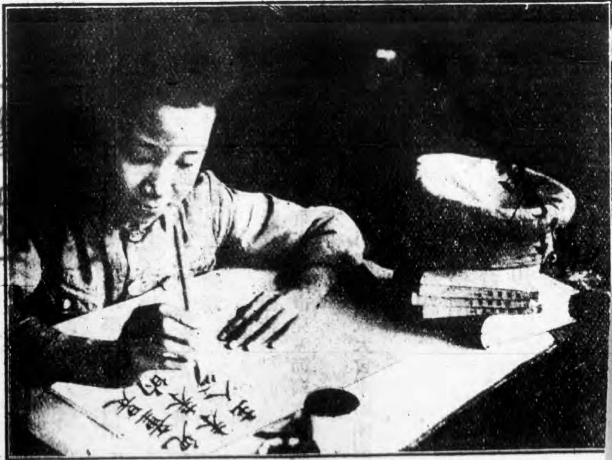
兒 童 節 試 筆